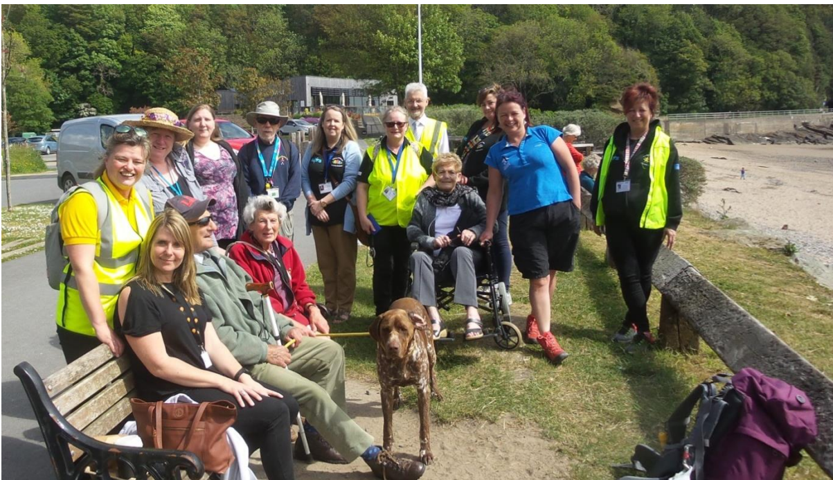
Y rhai a gymerodd ran ar Daith Gerdded Symudedd a gynhaliwyd yn Saundersfoot.

Amcan Cydraddoldeb 9: Erbyn 2024, bydd gennym fecanweithiau ar waith i alluogi ystod eang o grwpiau a phobl gymryd rhan mewn sgwrs barhaus am y Parc Cenedlaethol.