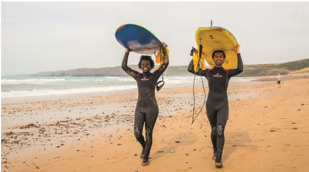
Syrffio ar Arfordir Sir Benfro.

Amcan Cydraddoldeb 4: Erbyn 2024, byddwn wedi datblygu a chyflawni prosiectau a chynlluniau sydd â budd cadarnhaol i'r rhai sy'n wynebu anghydraddoldeb, yn enwedig plant a theuluoedd ifainc o ardaloedd difreintiedig.