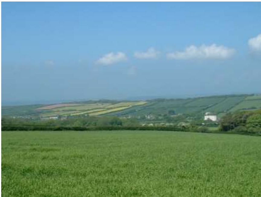
Ffigwr 1 - Llain-gaeau canoloesol i ochr ogleddol y pentref