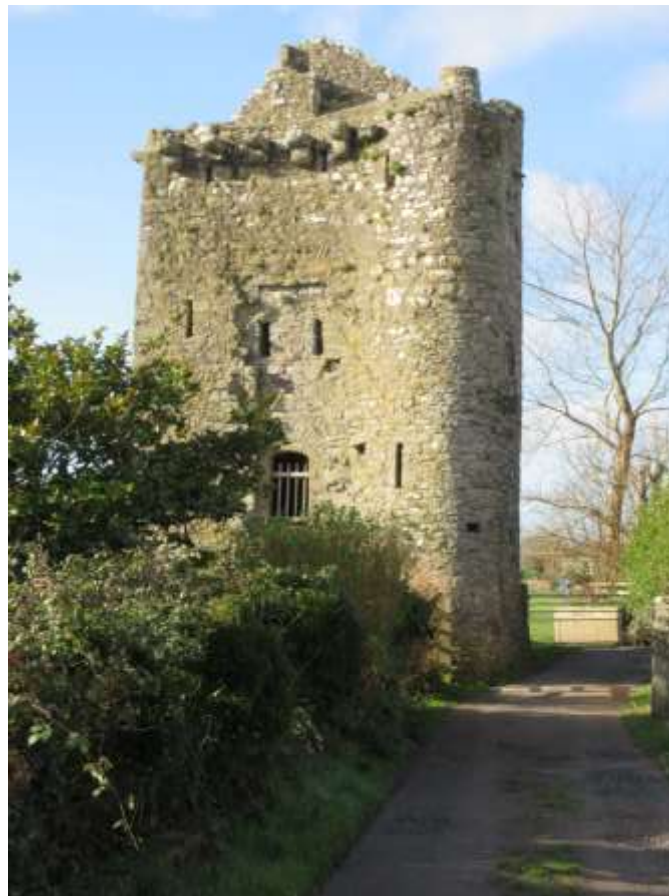
Ffigwr 2 - Tŵr Angle