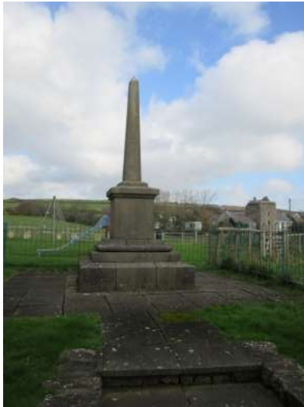
Ffigwr 11 - yr Ardd Goffa