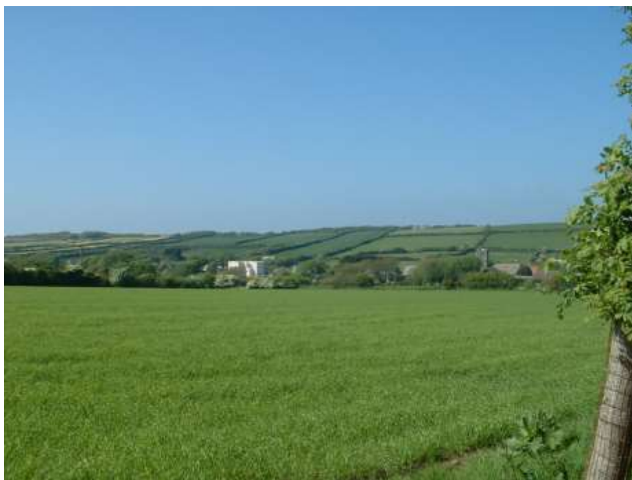
Ffigwr 23- Yr olygfa o'r ddynesfa o'r de-orllewin i'r pentref.