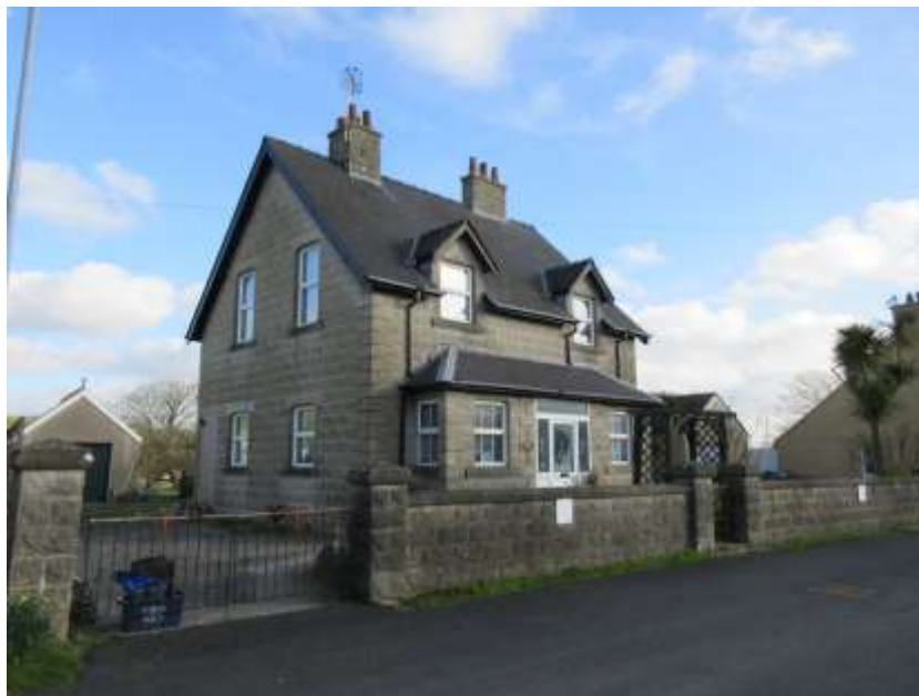
Ffigwr 22 - 64 Angle wedi'i adeiladu o flocliau concriid Angle.