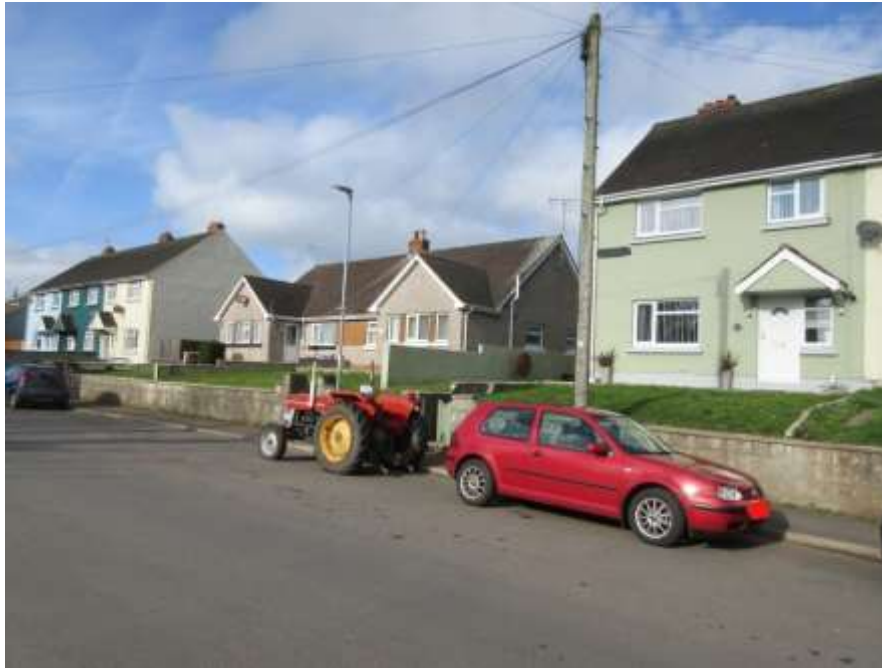
Ffigwr 14- Gwifrau'n tarfu ar yr olygfa