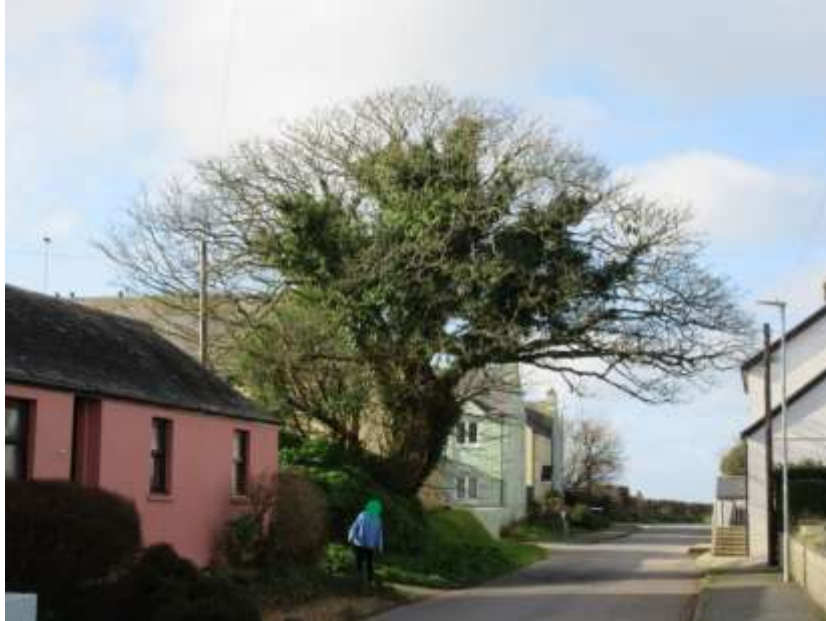
Ffigwr 12 - masarnwydden