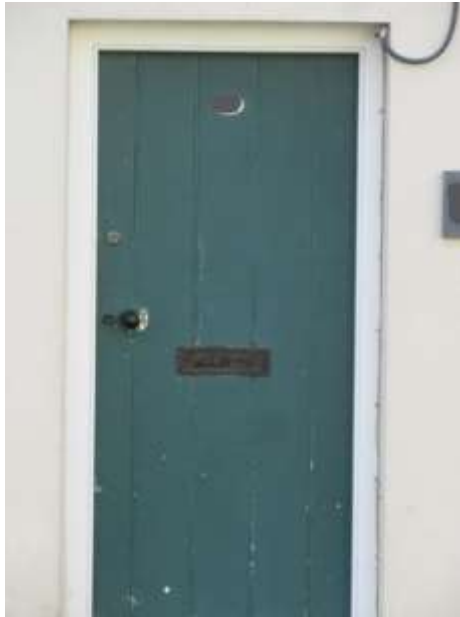
Ffigwr 17 - drws bordiog traddodiadol