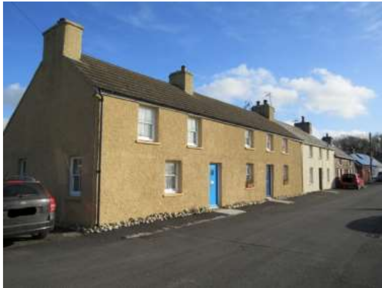
Ffigwr 9 - Adeiladau Cadarnhaol