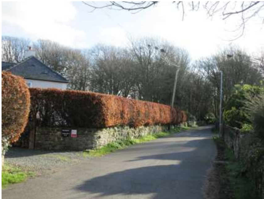
Ffigwr 13 - coed a nythfa frain, dwyrain Angle