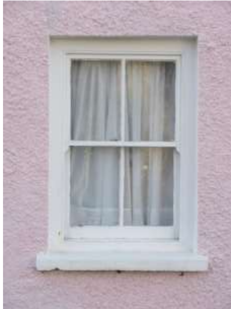
Ffigwr 16 Ffenestr godi pedwar paen arferol