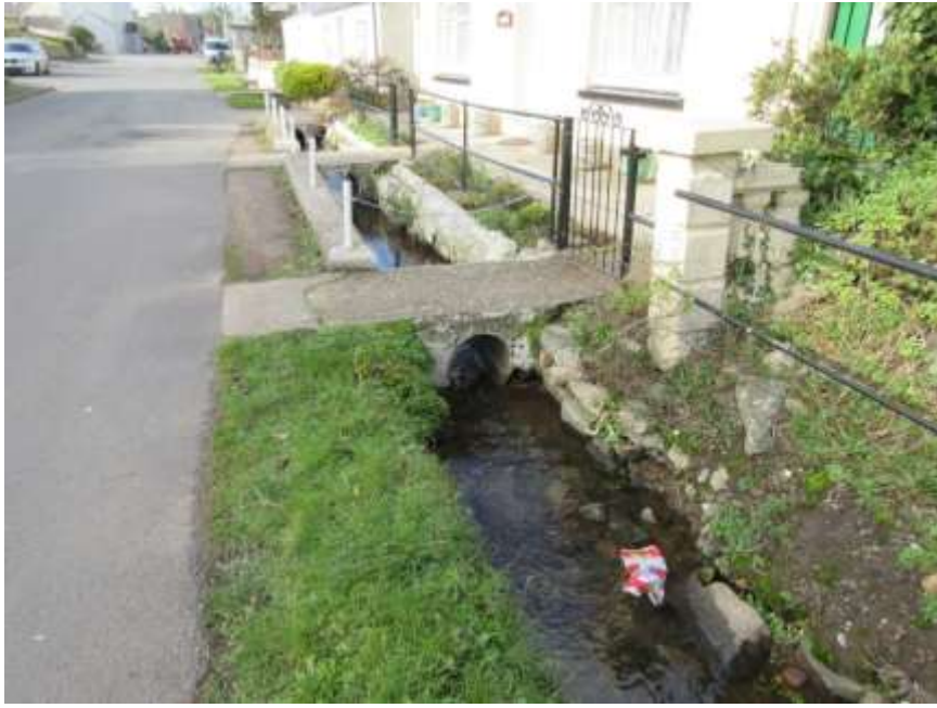
Ffigwr 5 - ceuffos y pentref