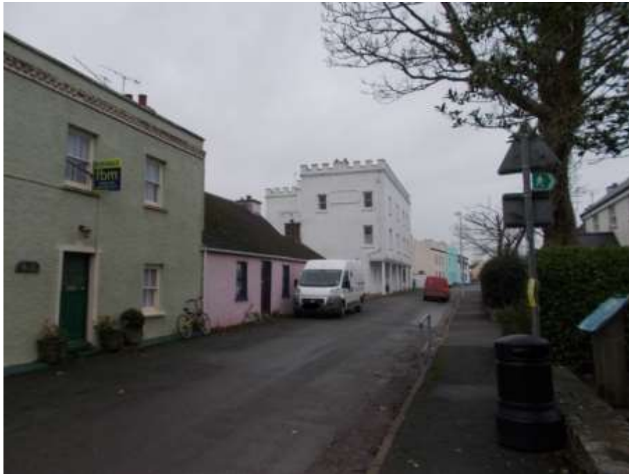
Ffigwr 7 - Stryd y pentref yn dangos graddfa anghyson gwelliannau'r ystad.

gwelliannau'r ystad ar ddiwedd y bedwaredd ganrif ar bymtheg yn amlwg ar rai grwpiau, lle mae rhai tai wedi cael wyneb newydd ac eraill wedi cadw eu graddfa a chymeriad cynhenid. Mae hen westy'r Globe yn adeilad trillawr.