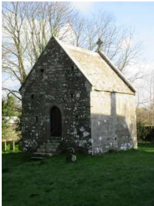
Ffigwr 3 - Esgyrnyd