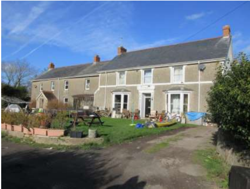
Ffigwr 19 - toeau llechi