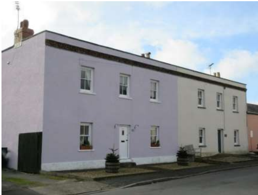
Ffigwr 8 – Adeiladau Rhestredig Gradd II.