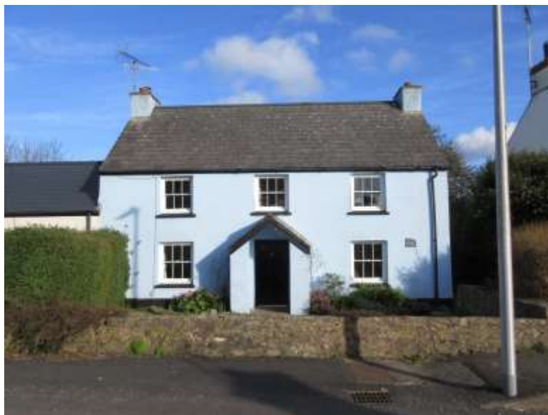
Ffigwr 10 - cwrtil allweddol - waliau gerddi