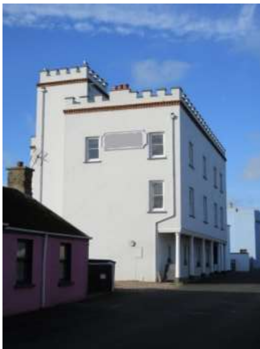
Ffigwr 6 - Enghraifft o adeilad tirnod