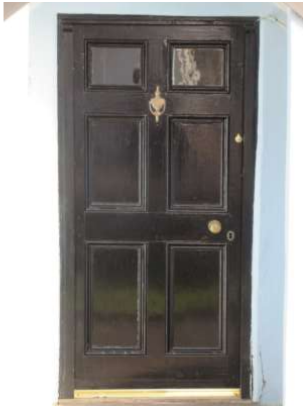
Ffigwr 18 - drws panelog