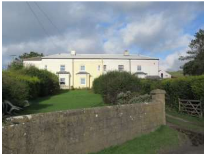
Ffigwr 15 - Gwaith rendro wedi'i baentio a manylion bricwaith.