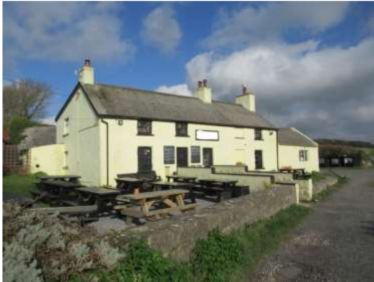
Ffigwr 21 - waliau terfyn o galchfaen a blociau Angle