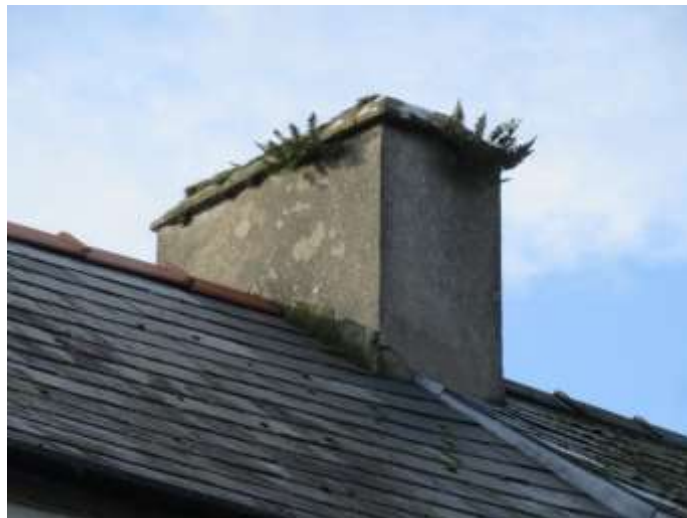
Ffigwr 20 - Enghraifft nodweddiadol o gorn simnai wedi'i rendro