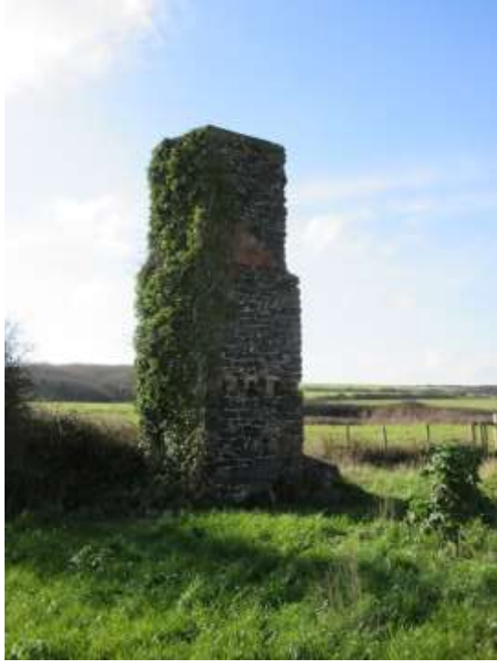
Ffigwr 4 - Gweddillion Gwaith Brics Angle