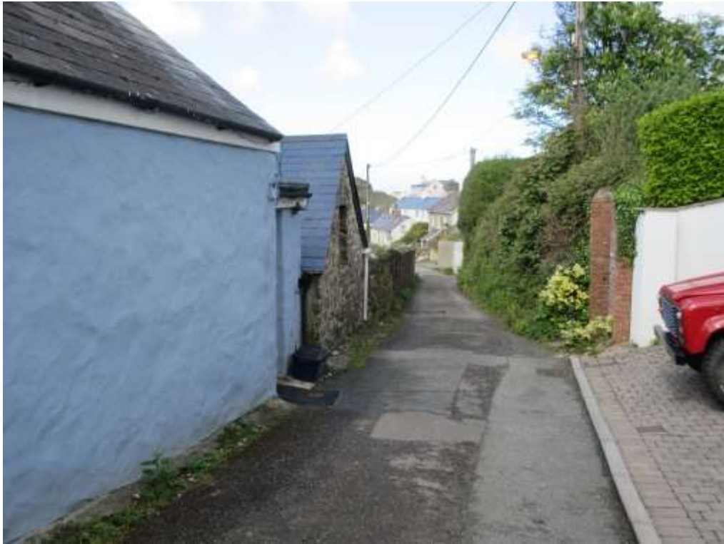
Ffigwr 35 - Cipolwg i lawr Heol Wesley