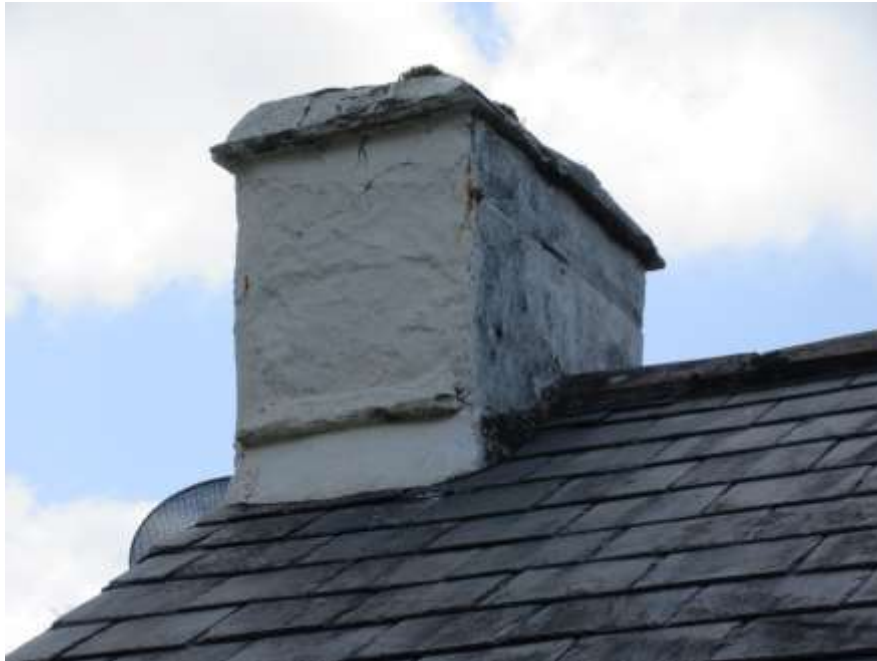
Ffigwr 28 - corn simdde carreg, Grove Place