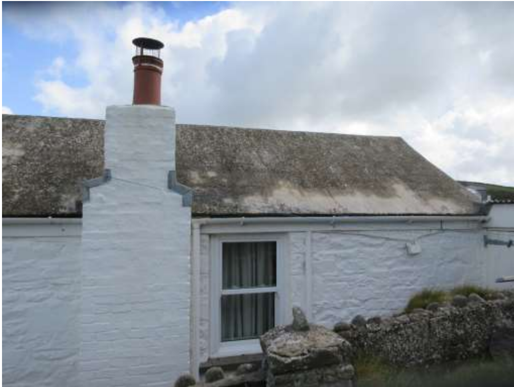
Ffigwr 26 - to wedi'i growtio â sment