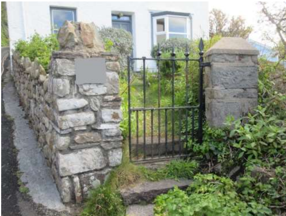
Ffigwr 31 - muriau a giât traddodiadol