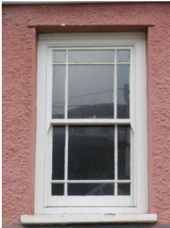
Ffigwr 20 - ffenestr codi wedi'i gwydro ychydig