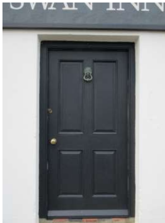
Ffigwr 23 - Drws pedwar panel