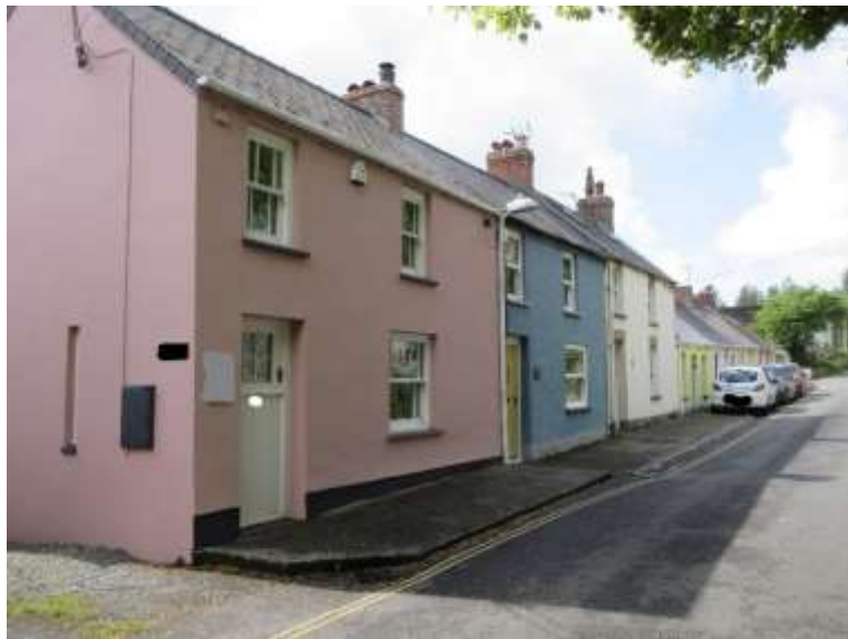
Ffigwr 14 -Ffasadau wedi'u rendro St Brides