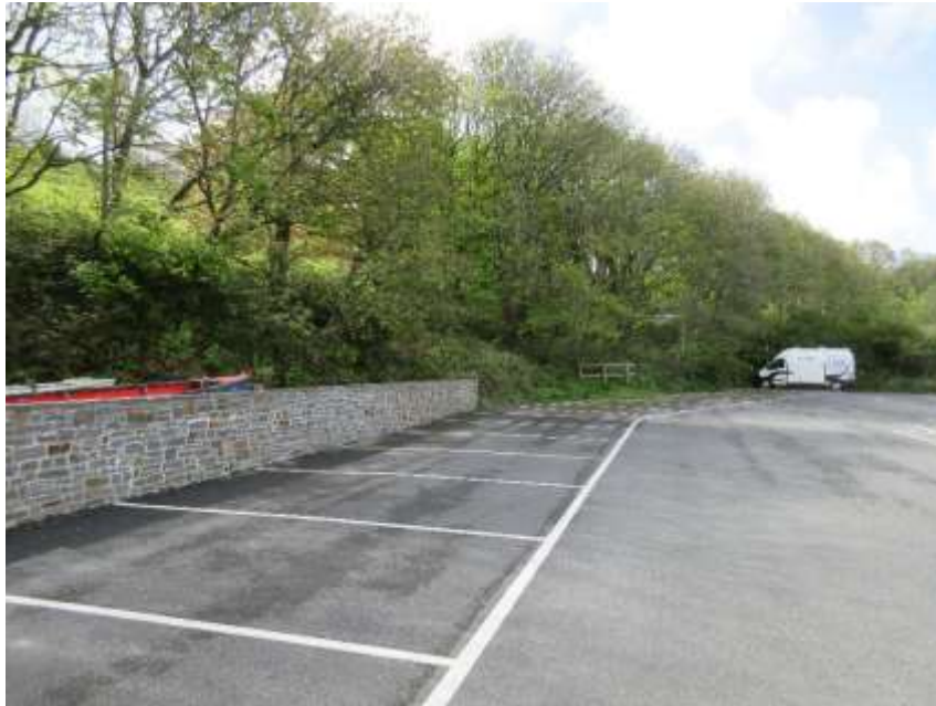
Ffigwr 12 - coed ar ymylon y maes parcio