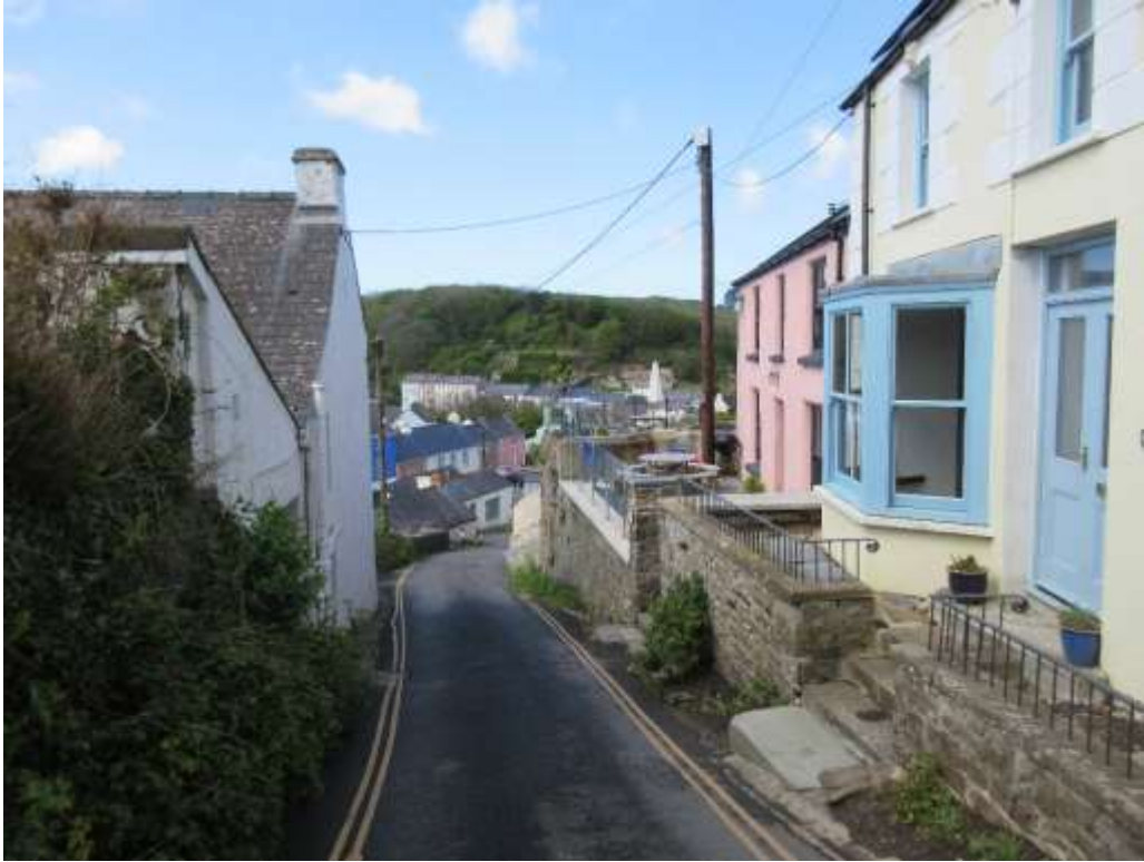
Ffigwr 33 - Yr olygfa i lawr i Fryn Waltwn