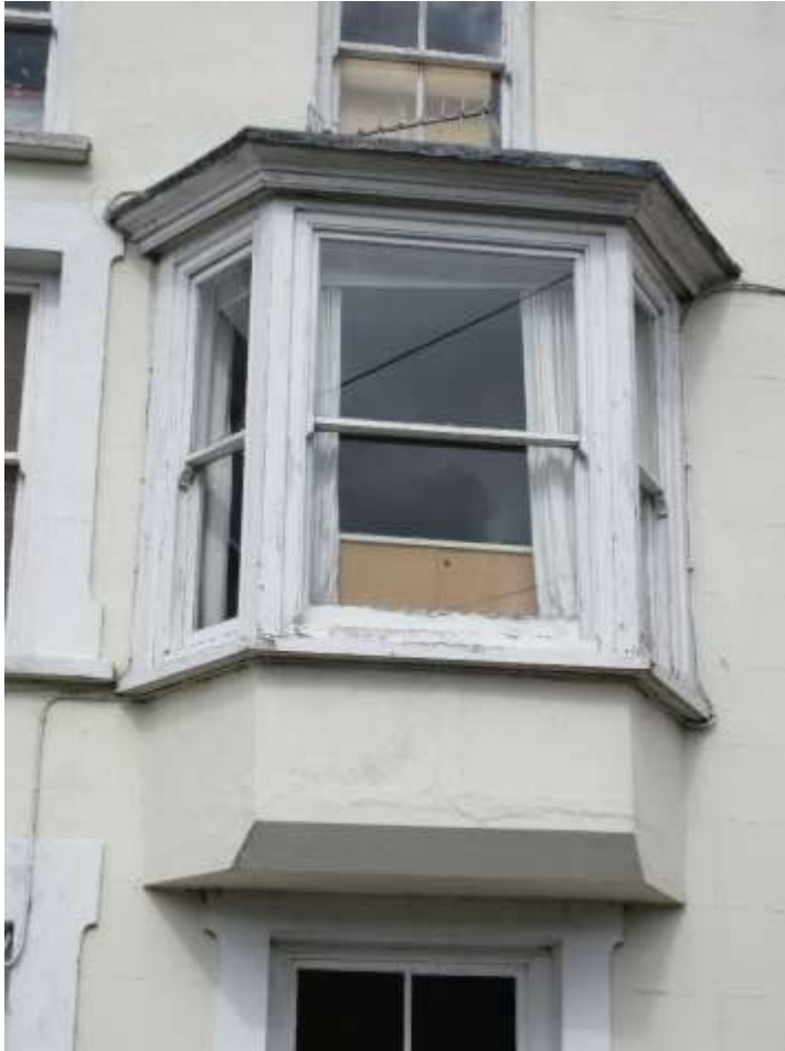
Ffigwr 21 - Ffenestr fae ar ogwydd