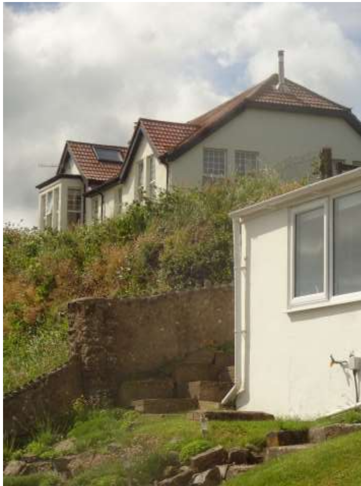
Ffigur 2 – Adeilad Tirnod

wynebu'r ffordd yn uniongyrchol. Mae ychydig o eiddo wedi'u gosod mewn tiroedd mwy, gan gynnwys y Maenordy a Whitehurst. Mae'r adeiladau hŷn yn cynnwys bythynnod unllawr a deulawr, gyda'r mwyafrif o'r datblygiad Fictoraidd diweddarach yn codi i drillawr ac eithrio'r teras unllawr ar hyd Heol Sain Ffraid. Mae The Peak yn sefyll allan fel adeilad tirnod , wedi'i osod yn amlwg ar y pentir.