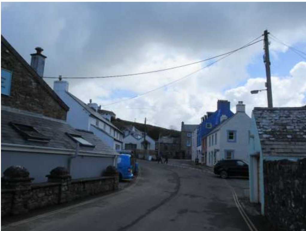
Ffigwr 1 - canol y pentref