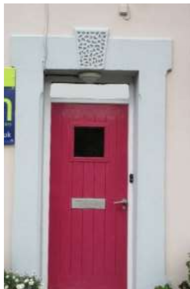
Ffigwr 15 -Manylion styco