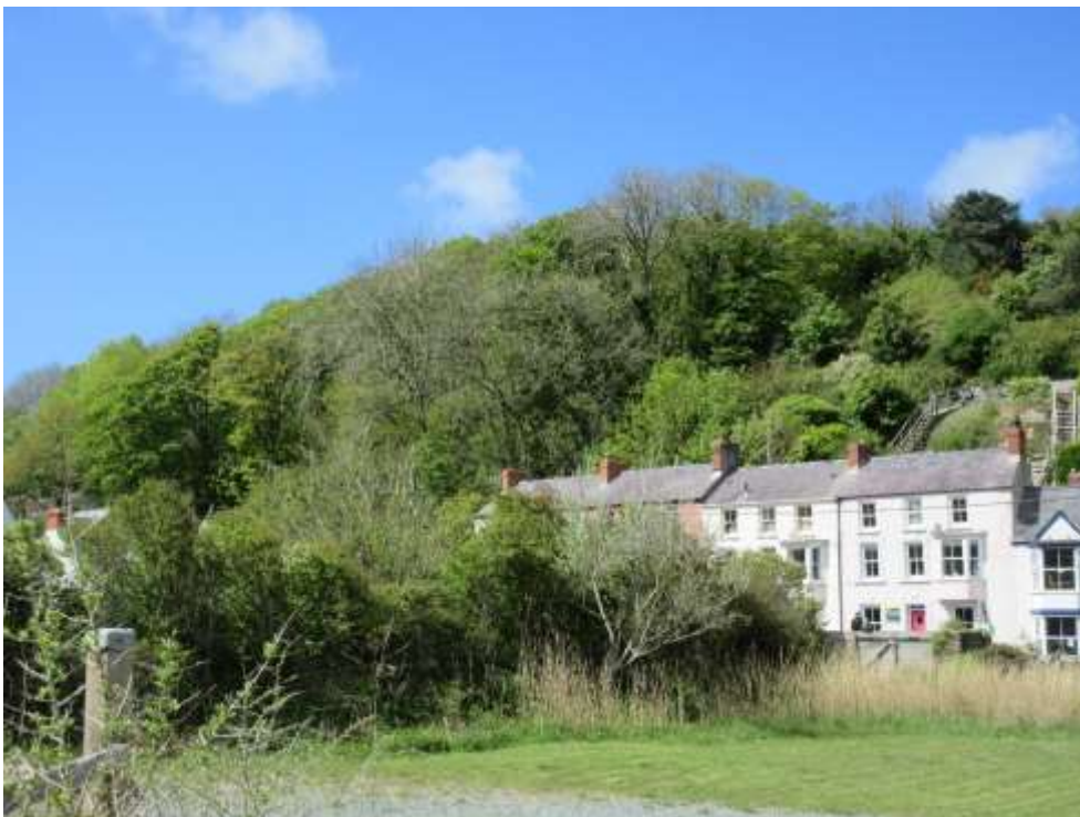
Ffigwr 11- coed uwchben Heol Sain Ffraid