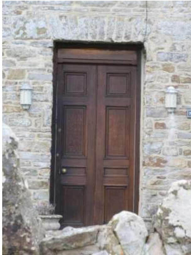
Ffigwr 22 - drws chwe phanel