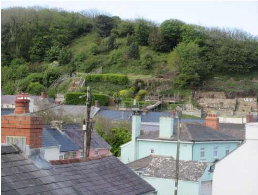
Ffigwr 10 - gerddi Terasog