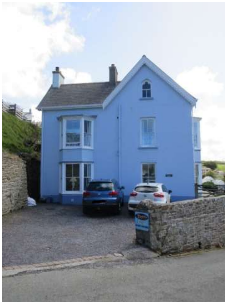
Ffigwr 27 – estyll rhwylllog