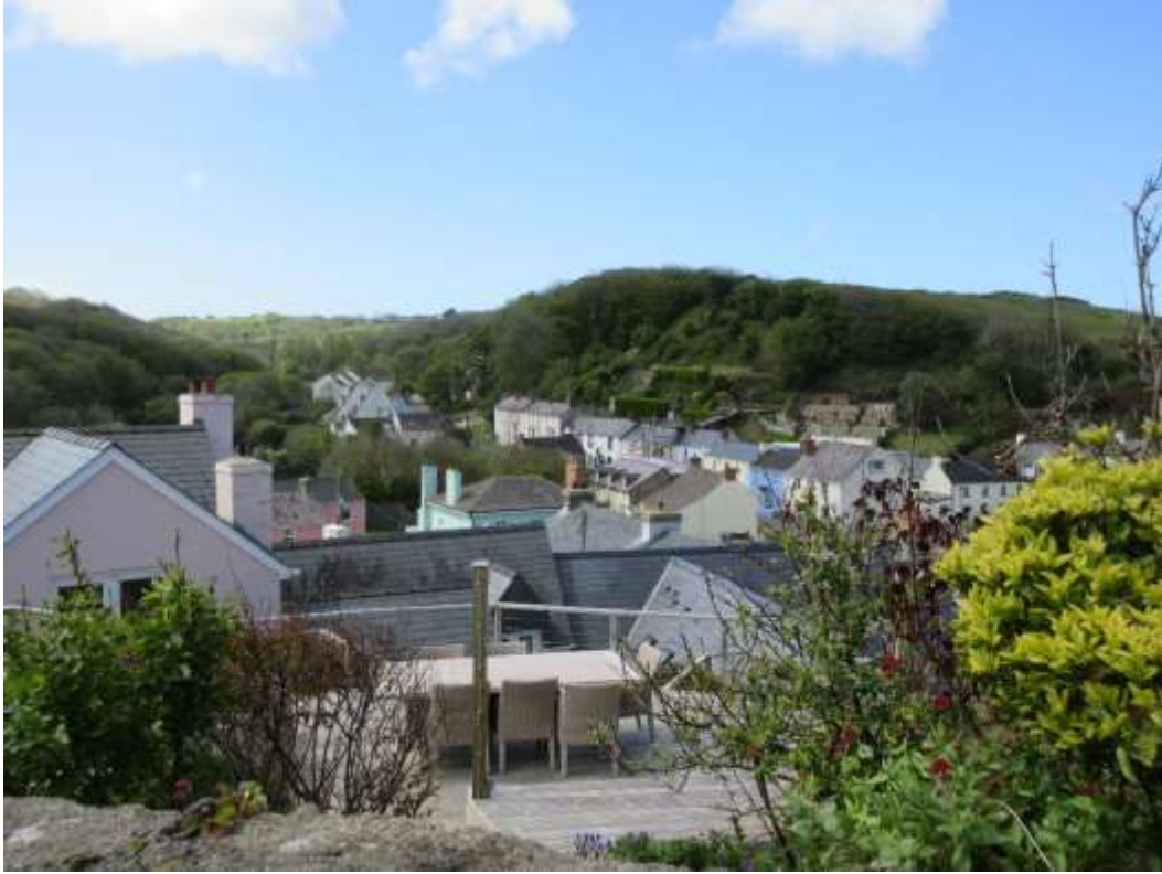
Ffigwr 8 - yr olygfa ar draws yr Awdal Gadwraeth o Fryn Settlands