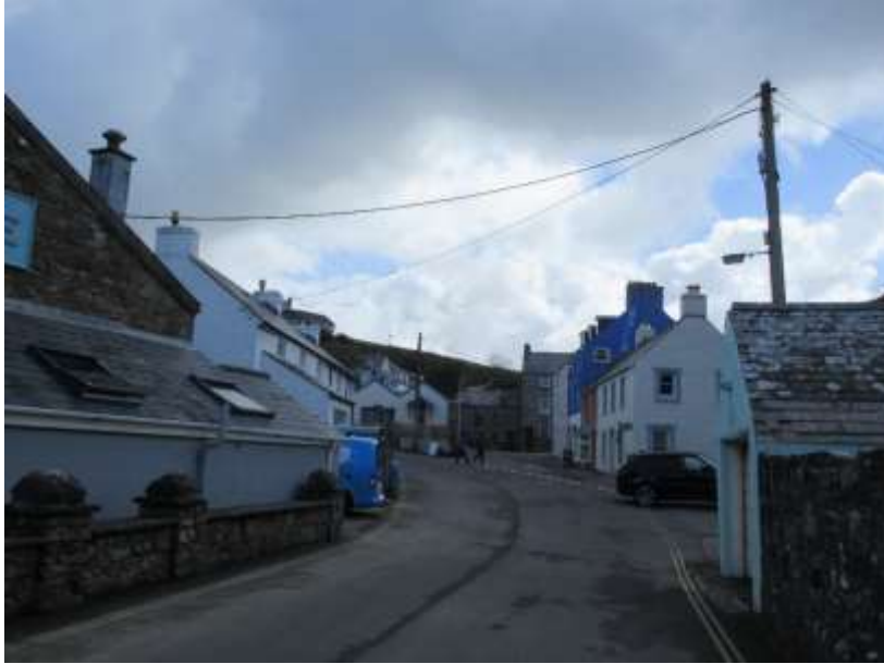
Ffigwr 13 - Gwifrau Grove Place