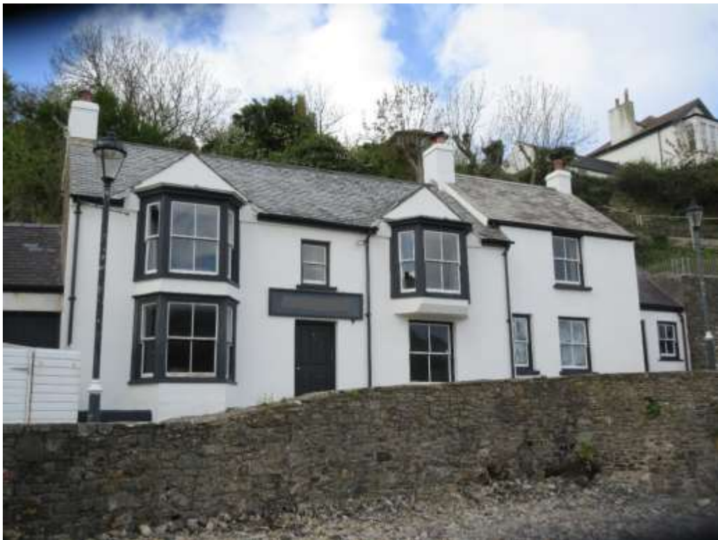
Ffigwr 4 - adeilad cadarnhaol