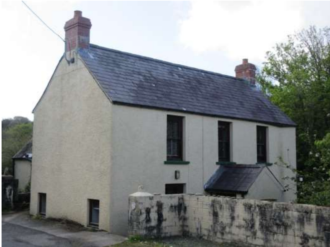
Ffigwr 3 - adeilad cadarnhaol