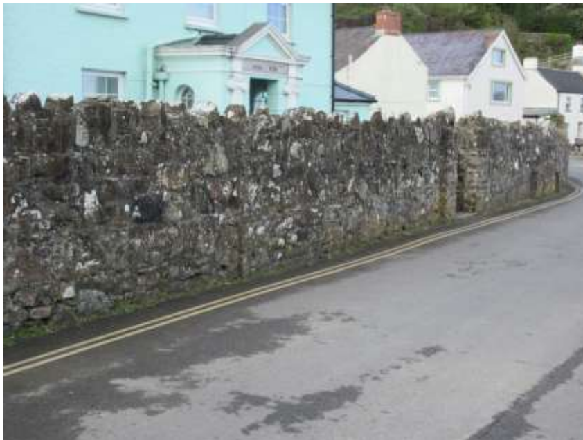
Ffigwr 7 - muriau gerddi