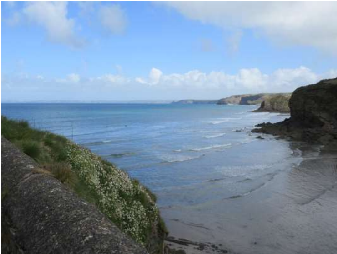
Ffigwr 34 - golygfeydd o'r môr o'r Pwynt