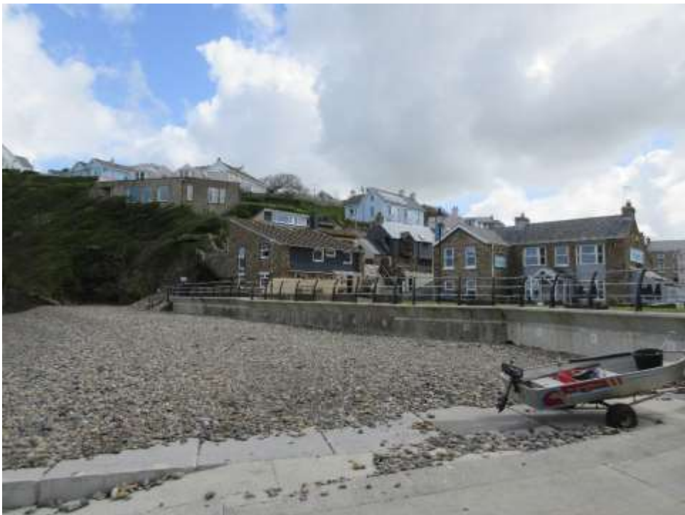
Ffigwr 9 - y traeth