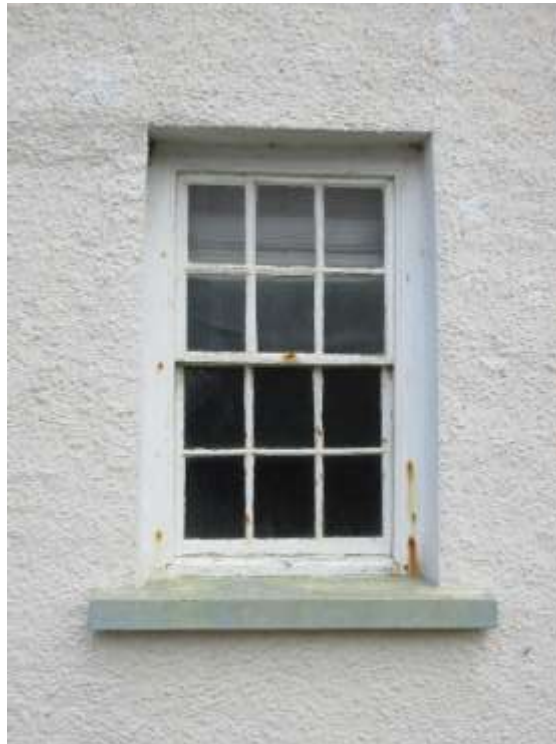
Ffigwr 18 - ffenestri godi gyda 12 chwarel