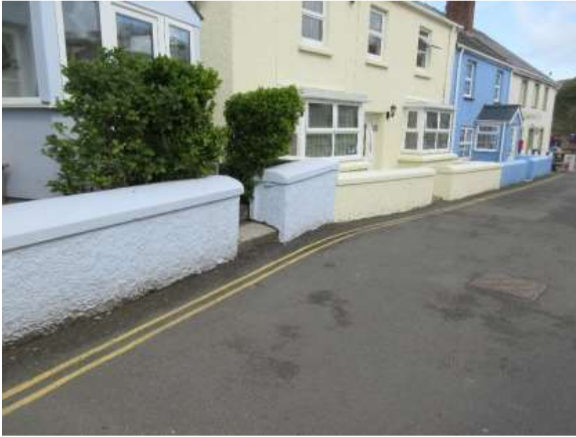
Ffigwr 30 - muriau gardd wedi'u rendro