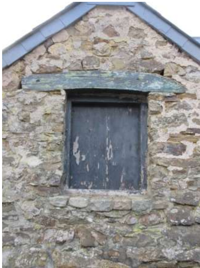
Ffigwr17 - rwbel wedi'i blastro â mortar