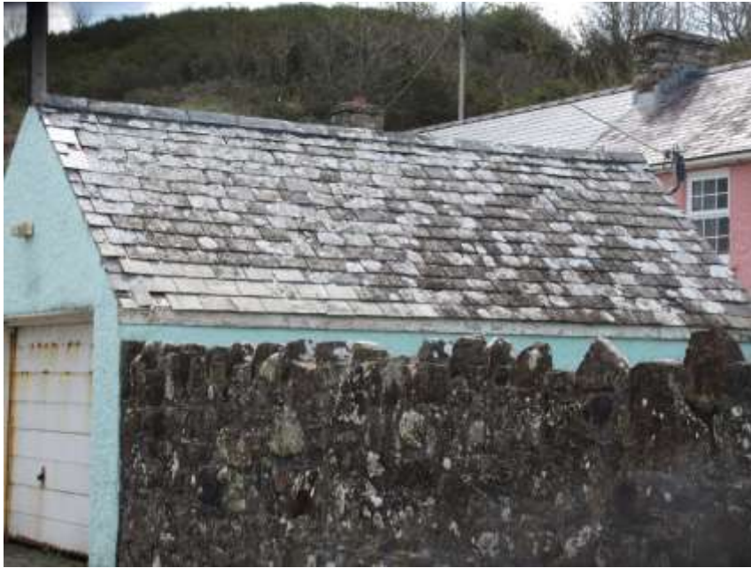
Ffigwr 24- to yn defnyddio llechi lleol