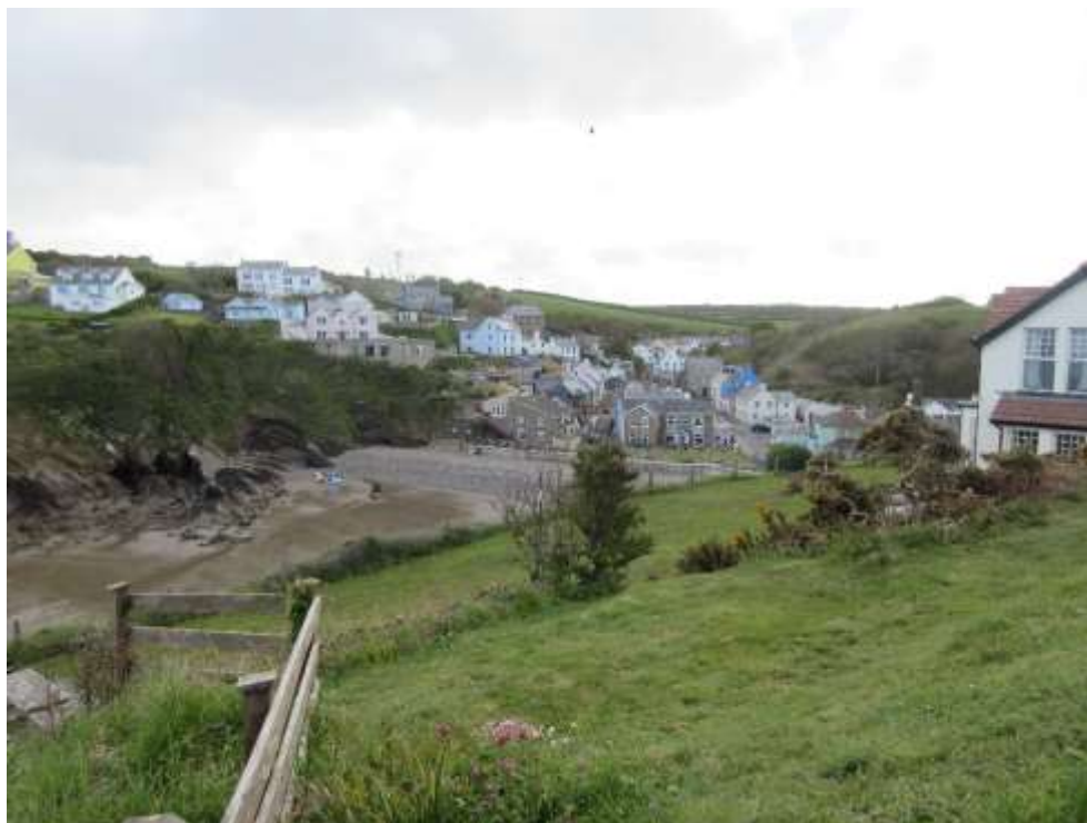
Ffigwr 32 - golygfa o Little Haven