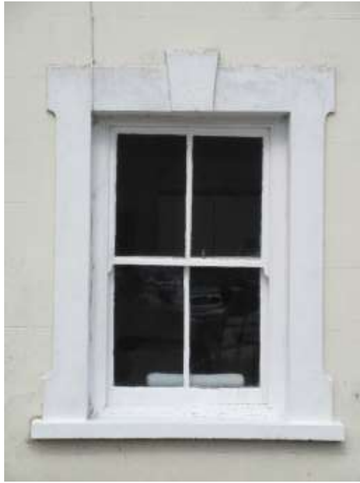
Ffigwr 19 - ffenestri godi gyda 4 chwarel