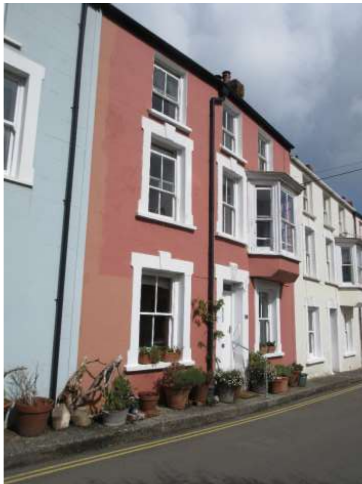
Ffigwr 6 - adeiladau cadarnhaol