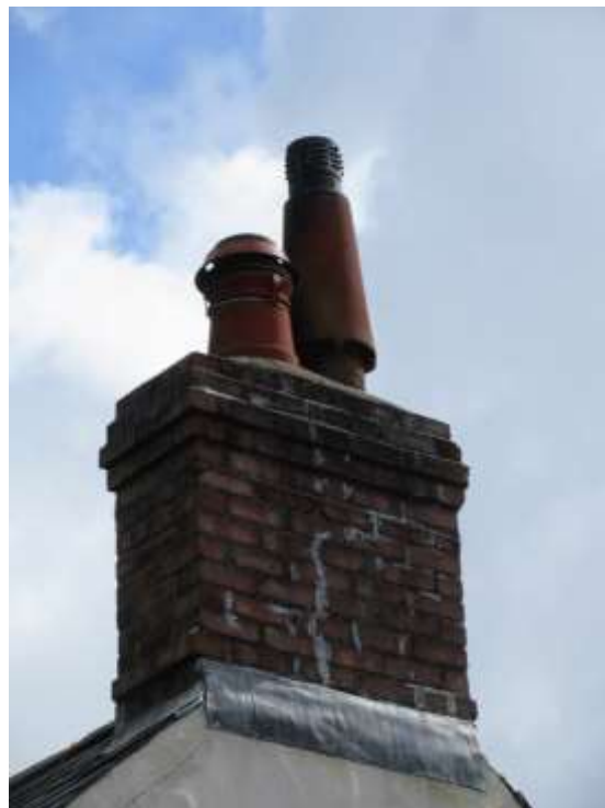
Ffigwr 29 - corn simdde brics