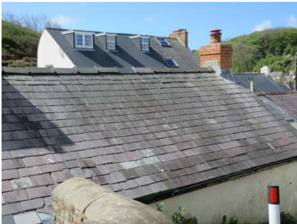
Ffigwr 25 - To o lechi Gogledd Cymru