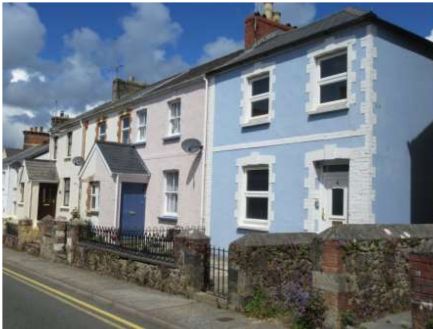
Ffigwr 30. Bythynnod yn cadw'r muriau gardd gwreiddiol