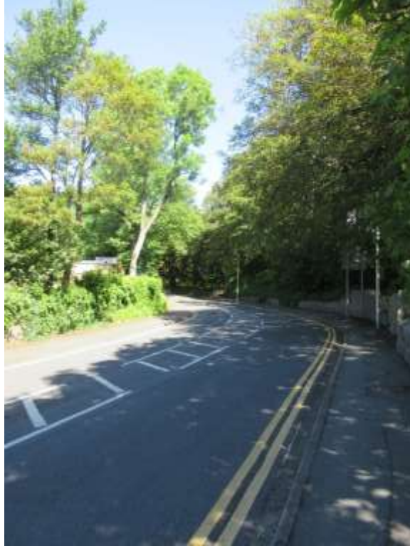
Ffigwr 17 - coed aeddfed, Heol Arberth