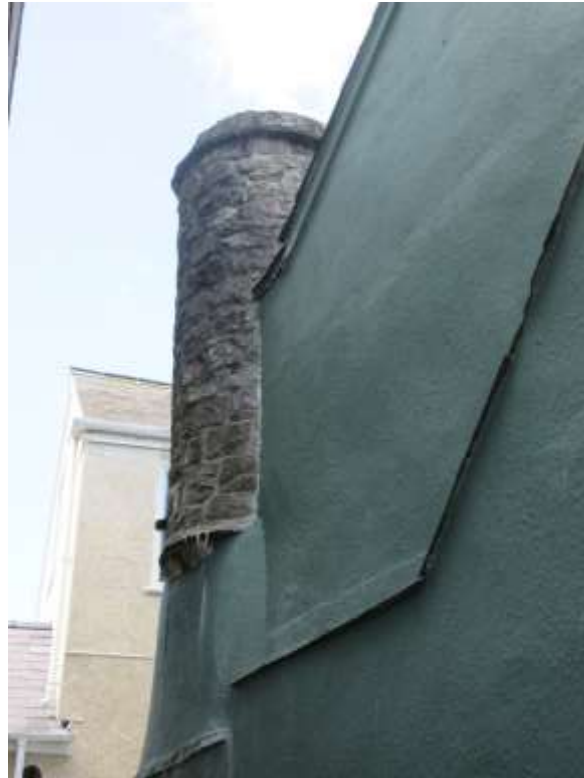
Ffigwr24 - Simneiau canoloesol, Rhodfa'r De

tirnod yn cynnwys yr hen reithordy. Mae ugain o adeiladau yn Rhestredig, gyda'r rhan fwyaf o'r adeiladau eraill yn adeiladau cadarnhaol .