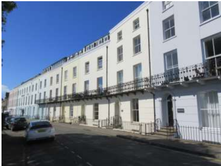
Ffigwr 35 – Wynebau nodweddiadol gyda gwaith stwco wedi'i baentio, The Croft, sy'n dyddio o tua 1830-60