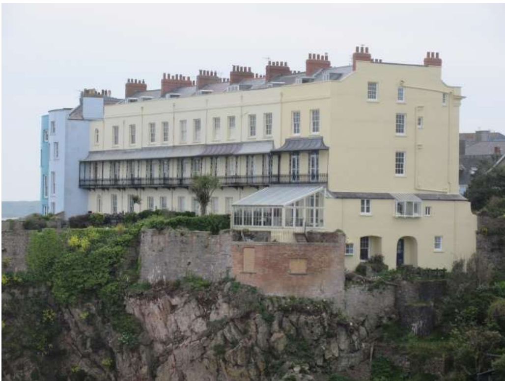
Ffigwr 55 - Balconïau o 1843, Teras Lexden