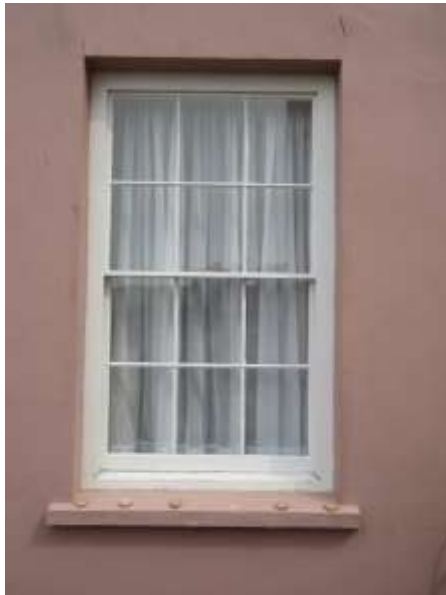
Ffigwr 40 -Ffenestr godi 12 cwarel nodweddiadol gyda barrau gwydro cain o ddechrau'r 19eg ganrif