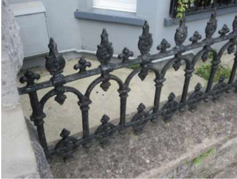
Ffigwr 63 -Rheiliau bach Fictoraidd