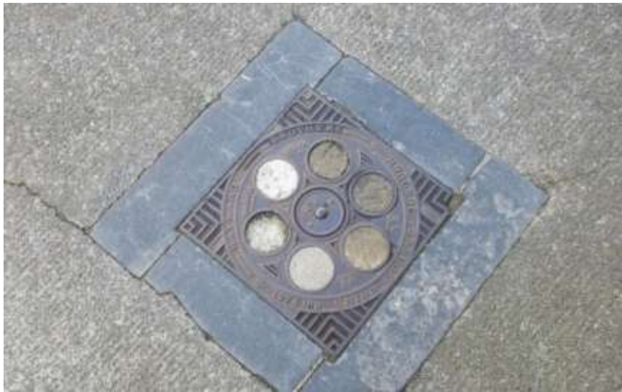
Ffigwr 19 - Gorchudd archwilio o 1862, Norton