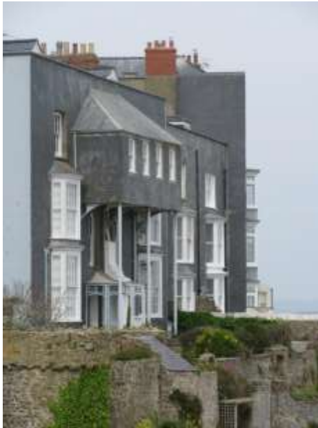
Ffigwr 65 - 'Toiledau ehedog' trawiadol, a ychwanegwyd ar ddiwedd y 19eg ganrif, Teras Rock