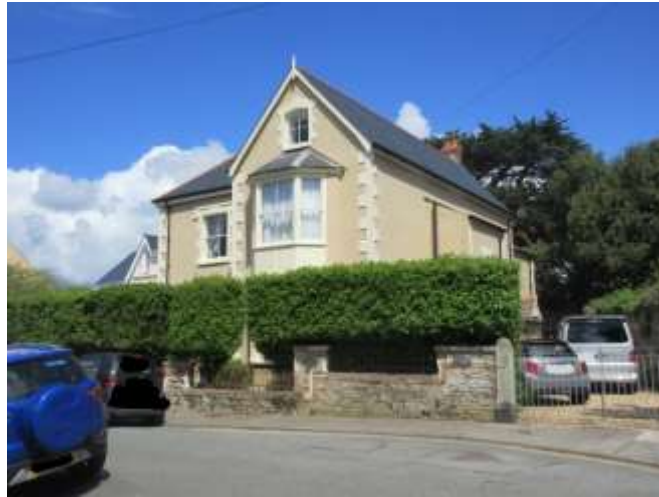
Ffigwr 29 - Adeilad o bwysigrwydd lleol