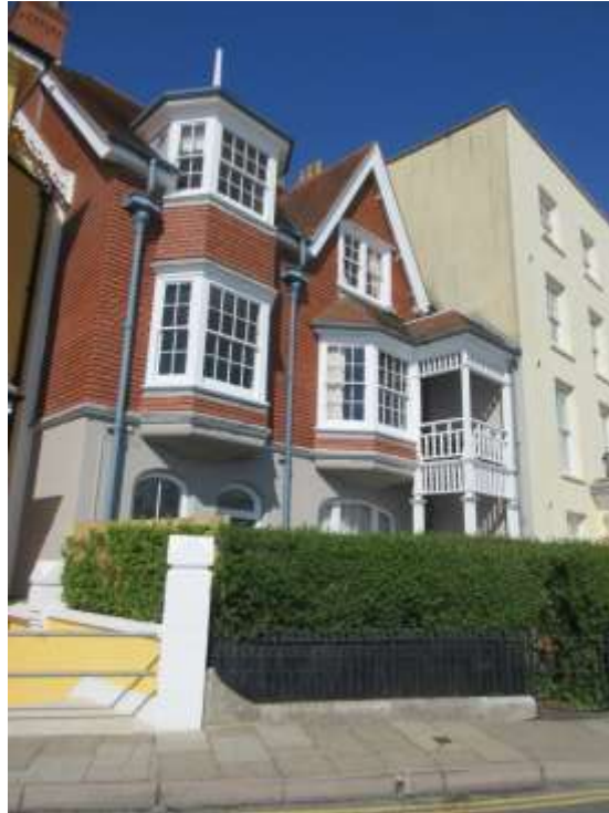
Ffigwr 15 - St Stephens, Y Croft