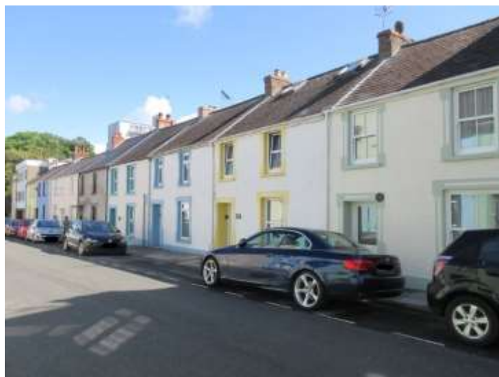
Ffigwr 14 -Bythynnod Norton