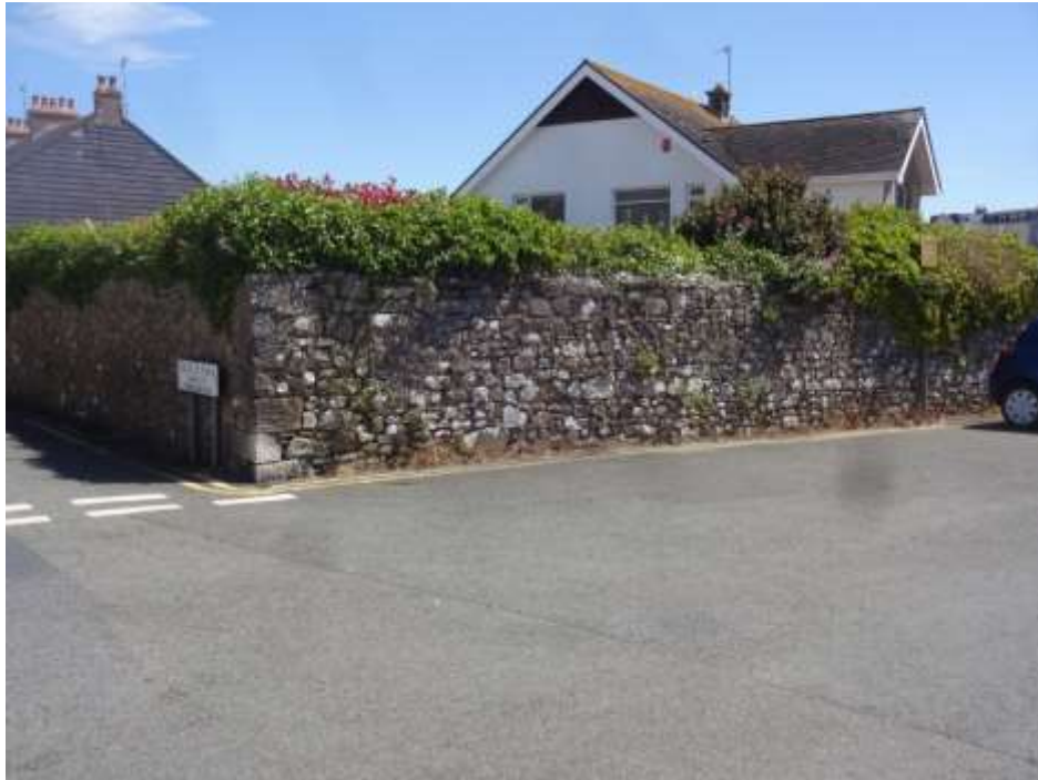
Ffigwr 27 - Muriâu amddiffynnol cynnar posib, Heol Battery