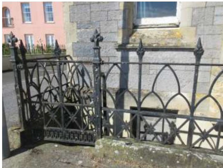
Ffigwr 61- Rheiliau Fictoraidd Gothig, Clwb Tref a Sir