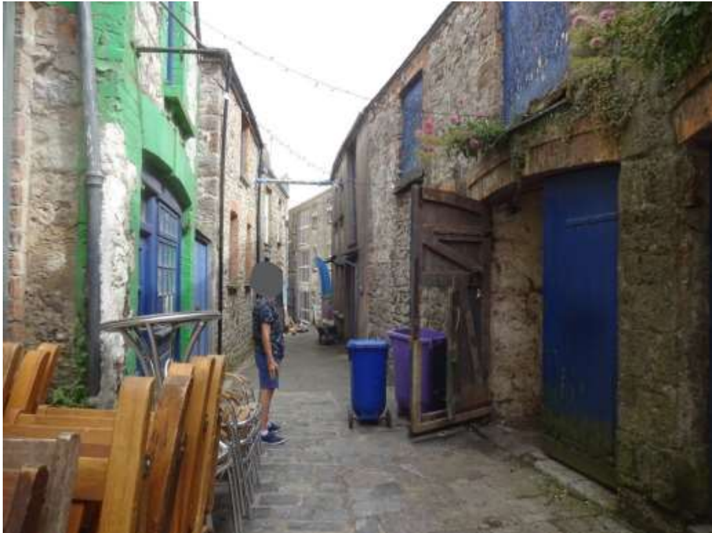
Ffigwr 2 - Lôn y Sarsiant