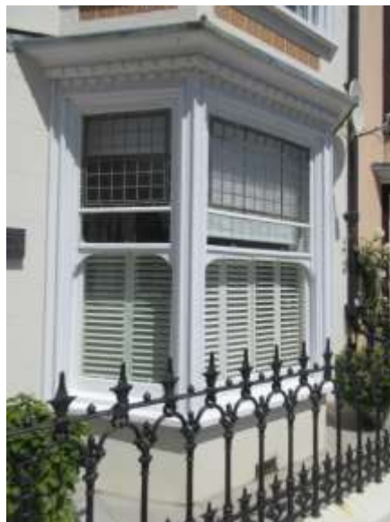
Ffigwr43 -Ffenestr fae Edwardaidd