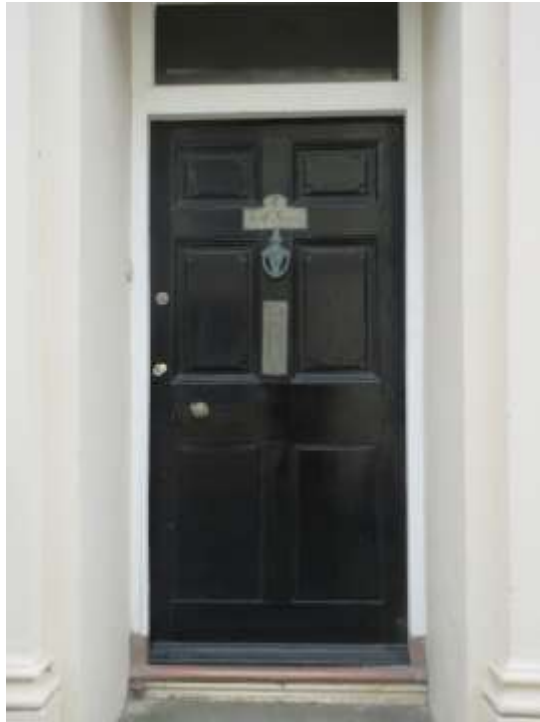
Ffigwr 45 -Drws o ddechrau'r 19eg ganrif