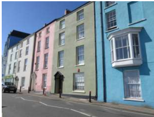
Ffigwr 13 - Teras Georgaidd hwyr, The Norton