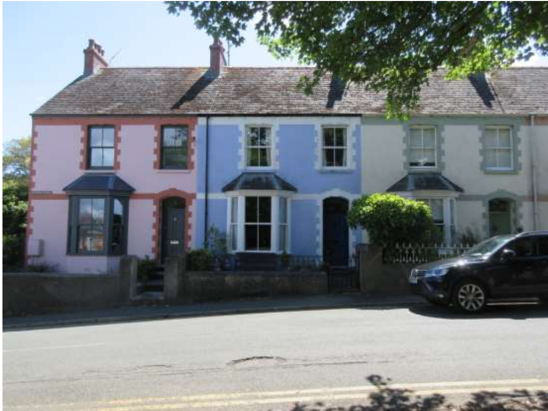
Ffigwr 38 - gwaith rendro a brics, Rhodfa Greenhill