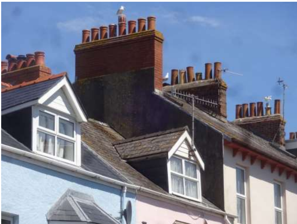
Ffigwr 53 - Simneiau traddodiadol gyda rhai potiau hanesyddol