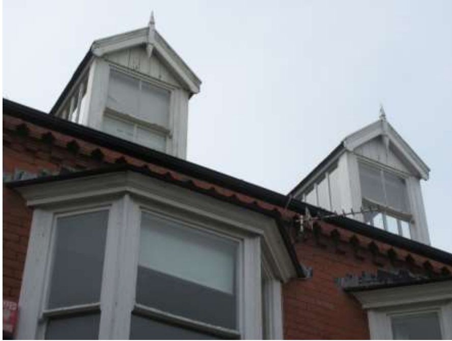
Ffigwr 51 -Byngalos dormer talcennog traddodiadol