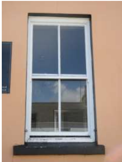
Ffigwr 42 - ffenestr godi gyda phedwar chwarel o ddiwedd y 19eg ganrif