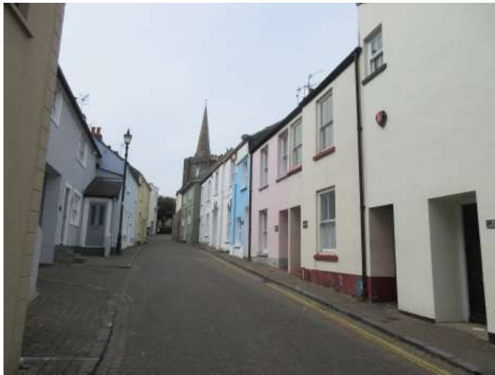
Ffigwr 6 - Bythynnod ar Stryd Cresswell