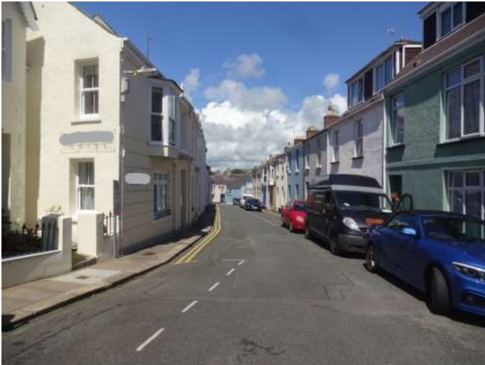
Ffigwr22 -Parc Culver