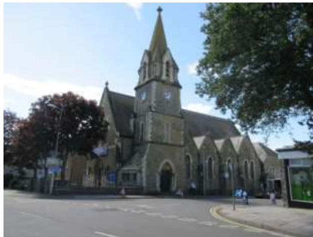
Ffigwr 28 - Eglwys Sant Ioan - adeilad tirnod