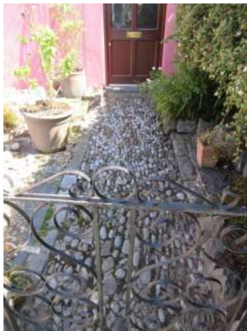
Ffigwr 33 -Llwybr coblog