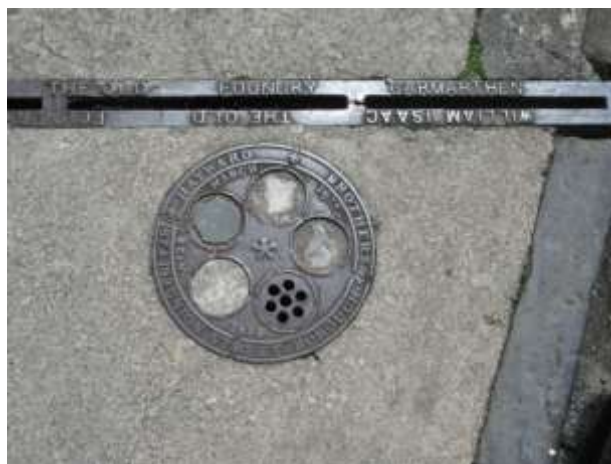
Ffigwr 66 - Gratin a gorchudd haearn bwrw Fictoraidd