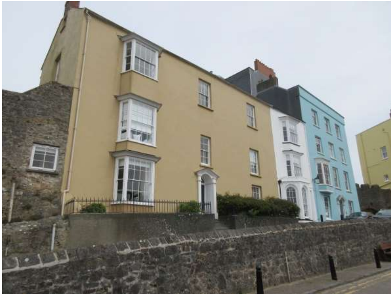
Ffigwr 49 - Cymysgedd o doeau talcennog a pharapet