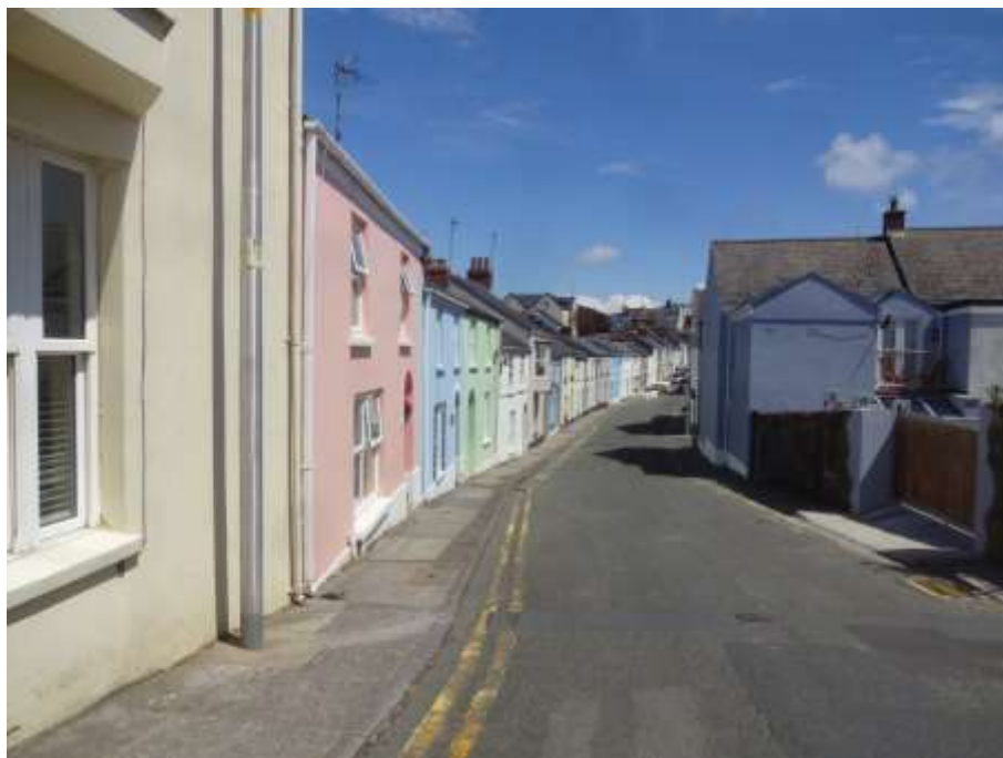
Ffigwr 23 - Bythynnod, Heol Trafalgar, o ddechrau'r 19eg ganrif