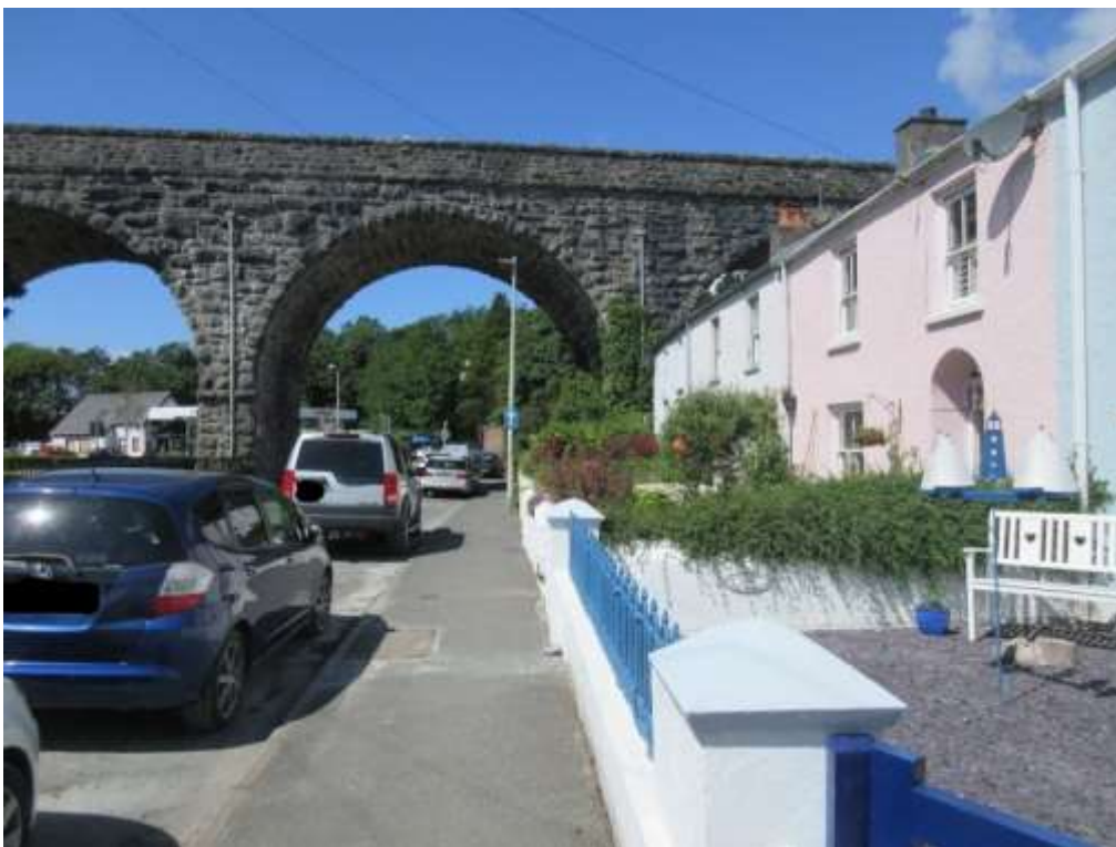
Ffigwr 32 - Traphont a bythynnod y rheilffordd