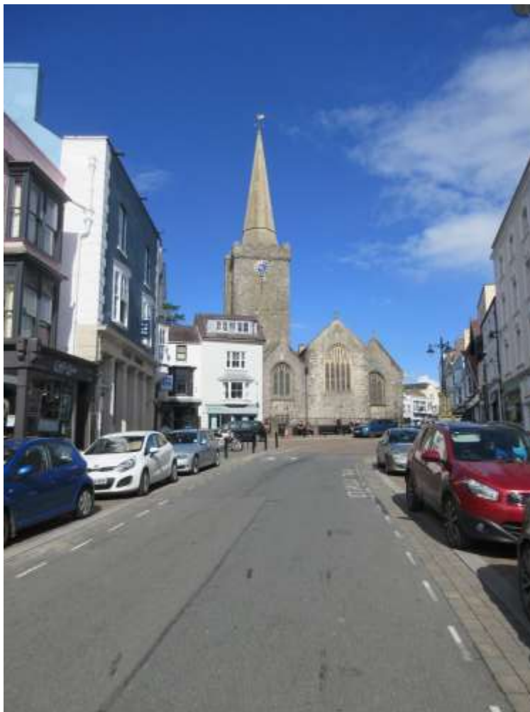
Ffigwr 1 - Sgwâr Tudor yn edrych tuag at Eglwys y Santes Fair