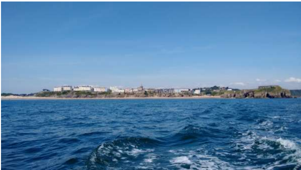
Ffigwr 69 - golygfeydd tua'r môr o'r de

Mae Map 3 yn crynhoi'r golygfeydd amlwg i'r Ardal Gadwraeth.