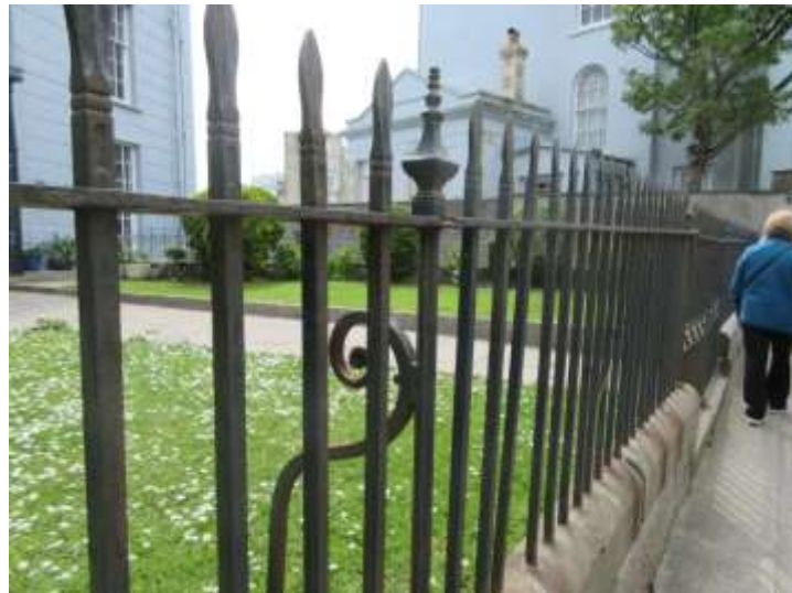
Ffigwr 58 -Rheiliau o'r cyfnod Sioraidd Hwyr, Teras Rock