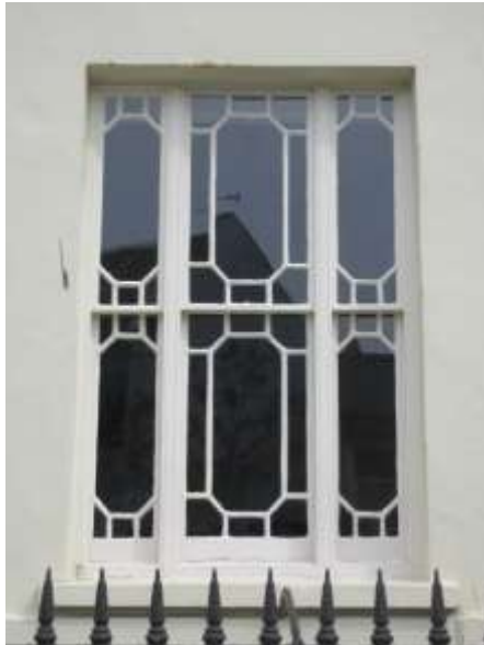
Ffigwr 41 - Gwydro siâp diemwnt 1843