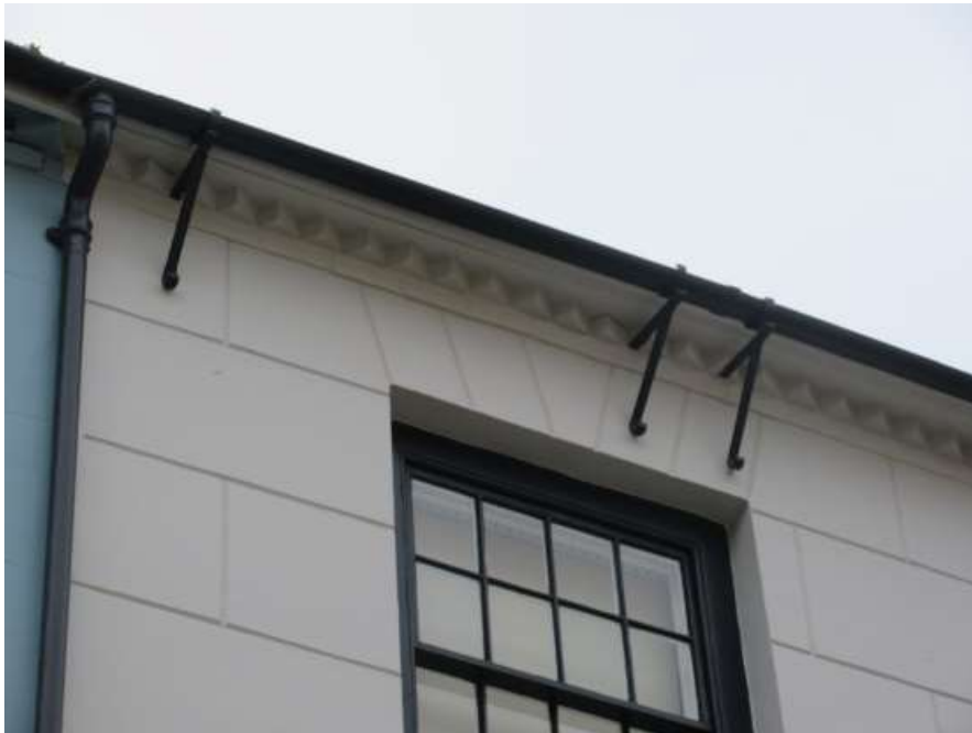
Ffigwr 50 - Manylion bondo 'cocsen'