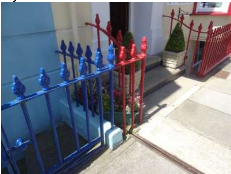
Ffigwr 25 - Rheiliau wedi'u gwneud yn lleol