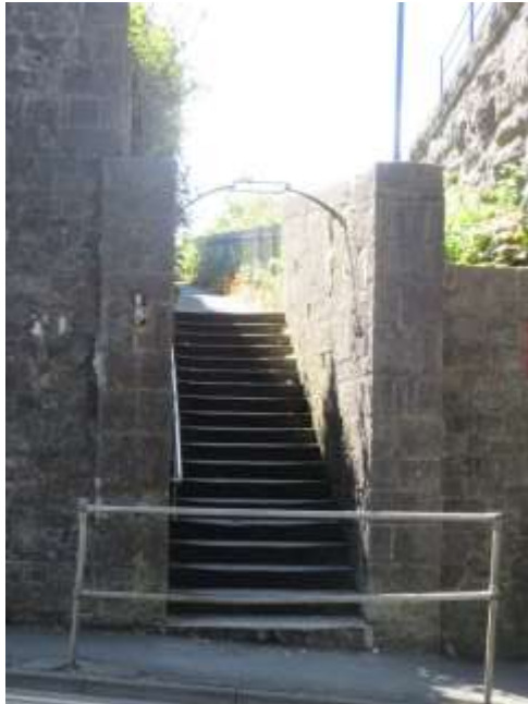
Ffigwr 34 - Hen risiau oddi ar Heol Greenhill