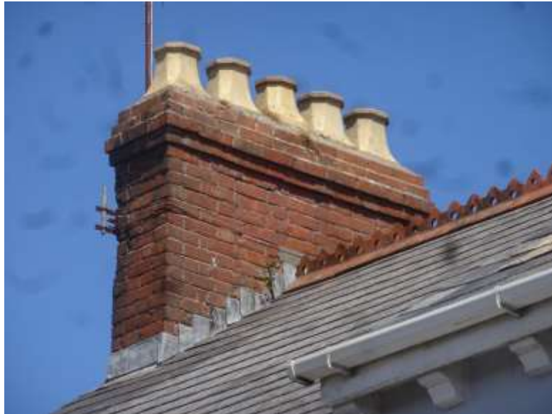
Ffigwr 54 - Cynr simdde a photiau simnai Edwardaidd