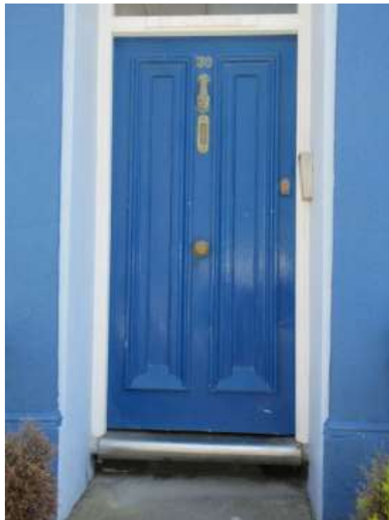
Ffigwr 46 - drws dyluniad dau banel o ddiwedd y 19eg ganrif