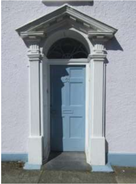
Ffigwr 44 - drws a ffrâm drws o ddechrau'r 19eg ganrif