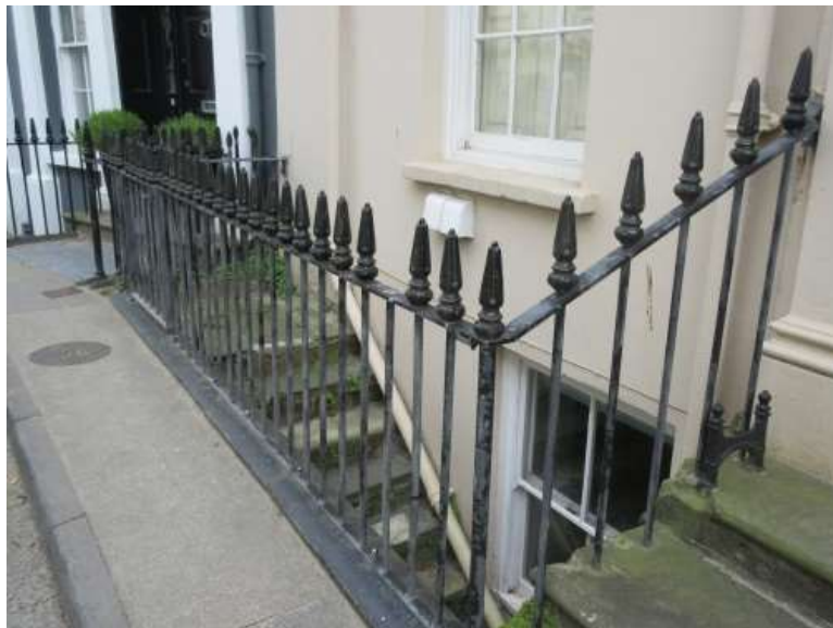
Ffigwr 7 Rheiliau o ganol Oes Fictoria