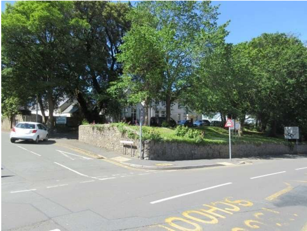
Ffigwr 31 - Tir coediog Tŷ Greenhill