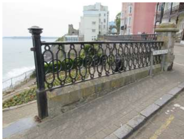
Ffigwr 62 -Rheiliau Fictoraidd ar lan y môr