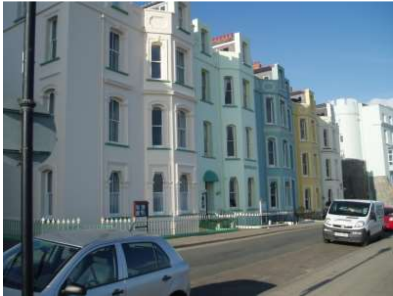
Ffigwr 20 - Teras ar y Promenâd yn y 1860au