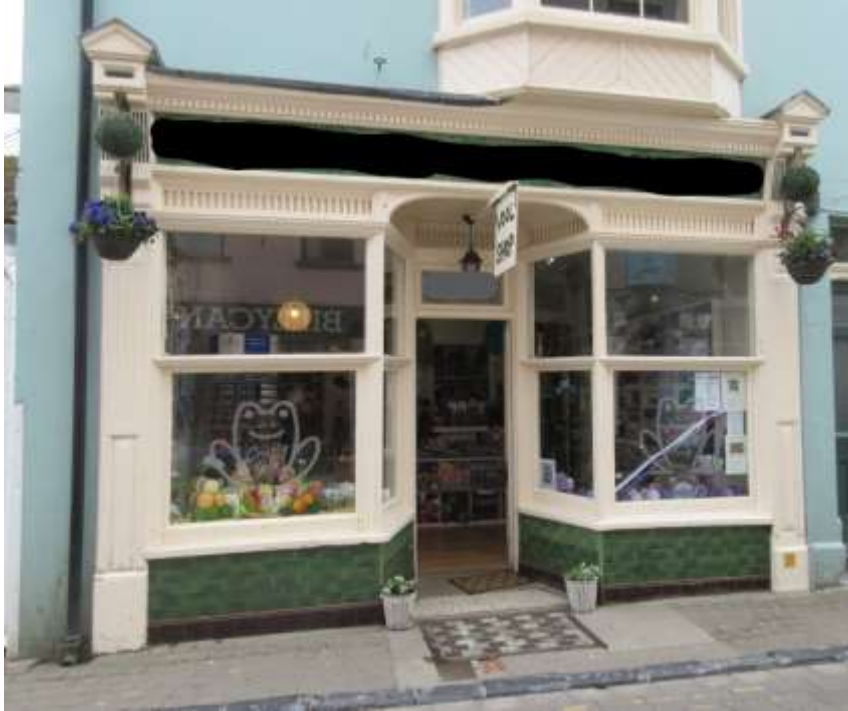
Ffigwr 4 - Blaen siop Edwardaidd cain