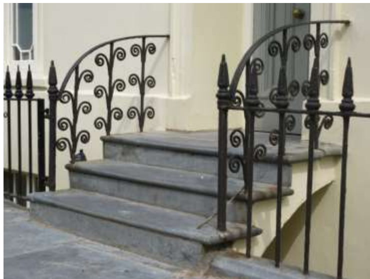
Ffigwr 59 - Balwstradau haearn sgrôl o ddechrau'r 19eg ganrif