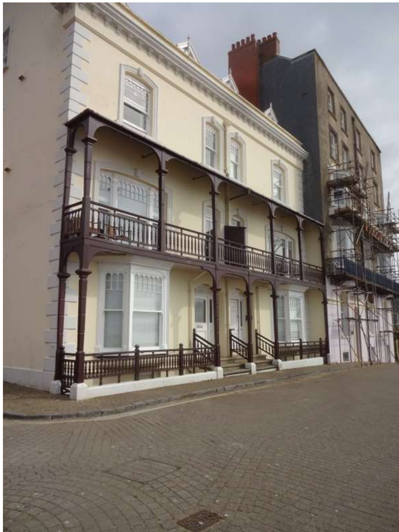
Ffigwr 57 -Balconïau pren Edwardaidd, Paragon