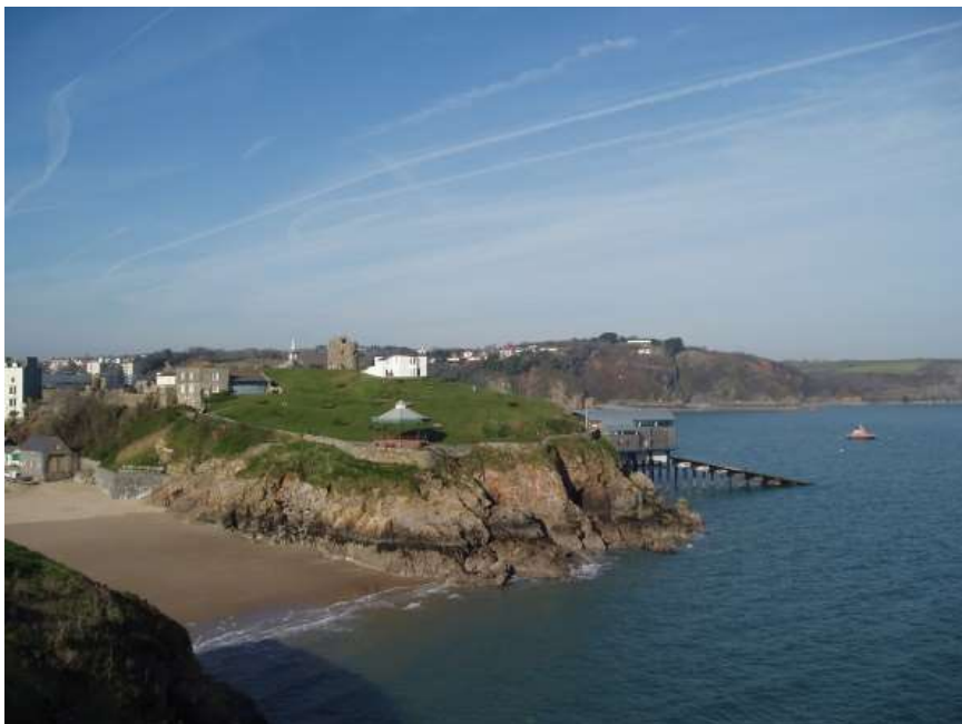
Ffigwr 9 -Rhiw'r Castell yw'r Ardal Agored Hanfodol fwyaf