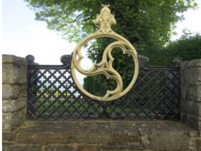
Ffigwr 18 - rheiliau wedi'u hailddefnyddio o'r pier Fictoraidd a ddymchwelwyd