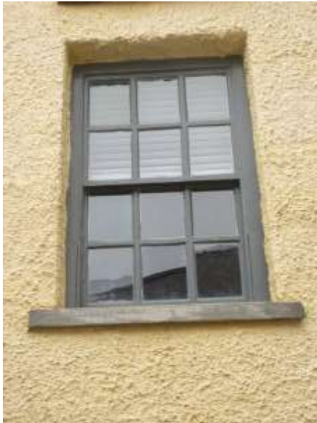
Ffigwr 39 -Ffenestr gyda barrau gwydro tew o'r cyfnod Georgaidd cynnar