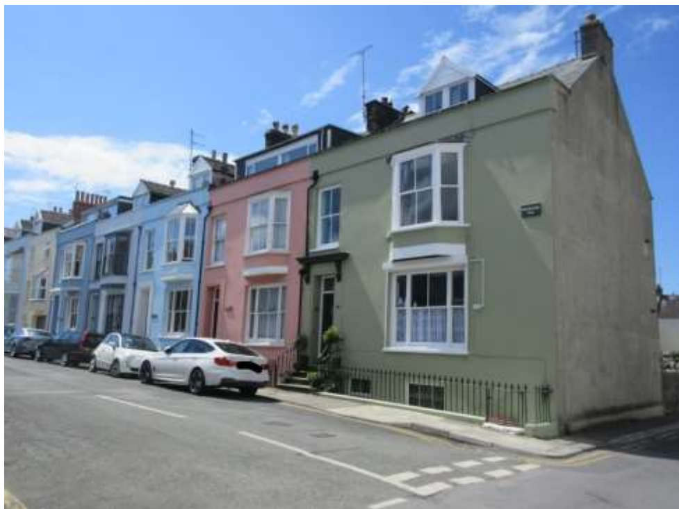
Ffigwr 21 -Heol Picton, 1869