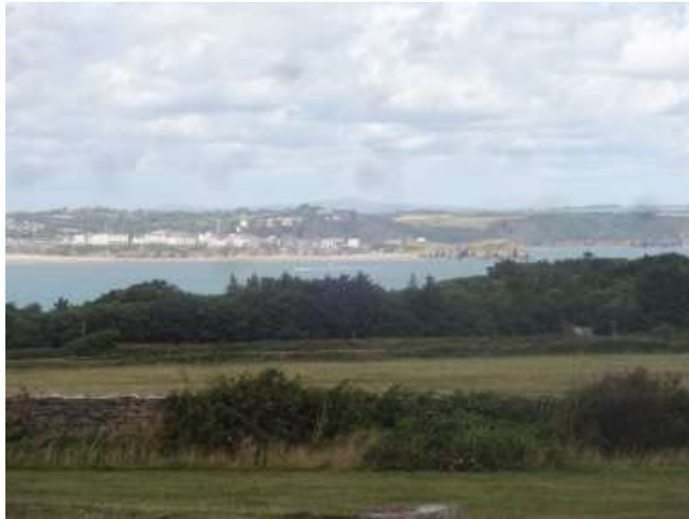
Ffigwr 68 -Yr olygfa o Ynys Bŷr