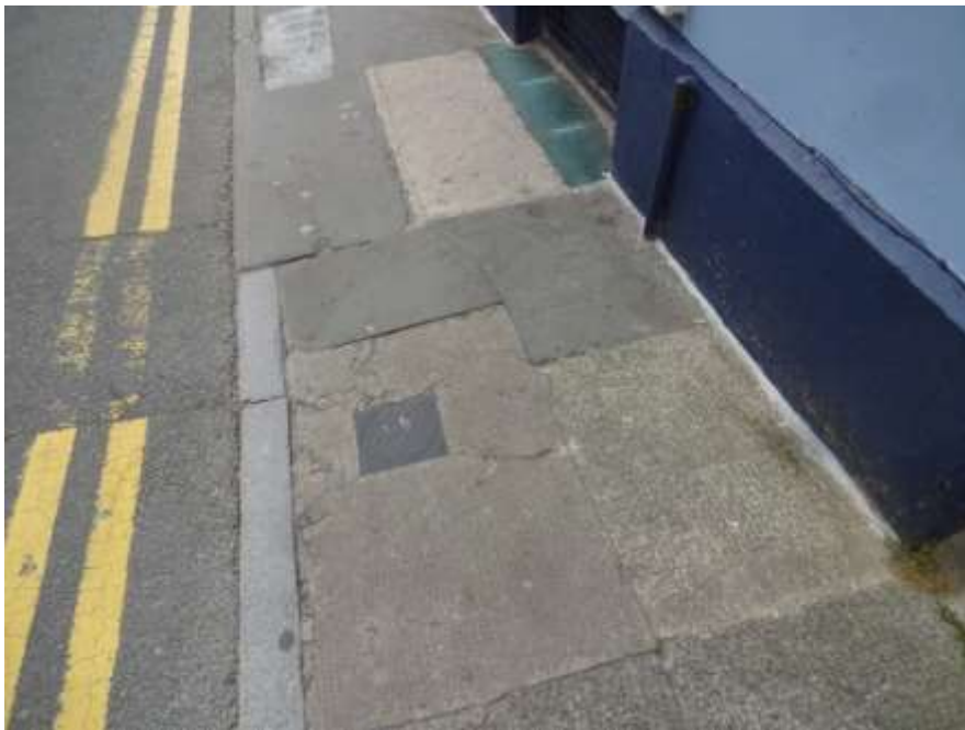
Ffigwr 11 - palmentydd o safon wael, Stryd Cresswell