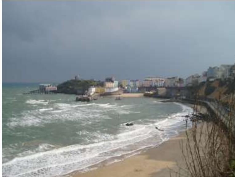
Ffigur 67 -Yr olygfa eiconig o Harbwr Dinbych-y-pysgod