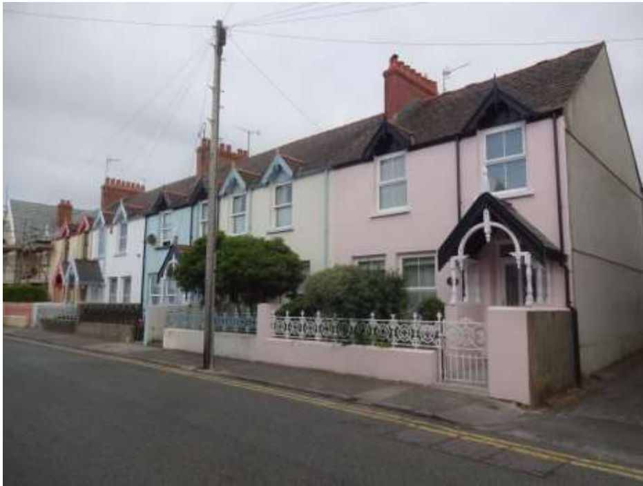
Ffigwr 26 - Adeiladau cadarnhaol - hen Dai'r Gwylwyr y Glannau