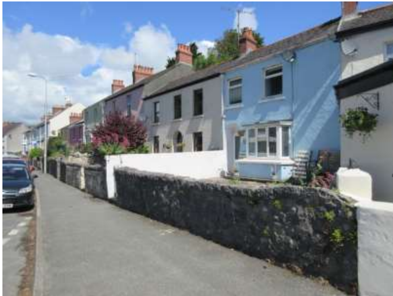
Ffigwr 64 - Cyrtiau blaen waliau cerrig, y Grŵn