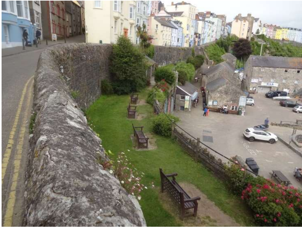
Ffigwr 10 Heol Paxton, Ardal Agored Hanfodol lai