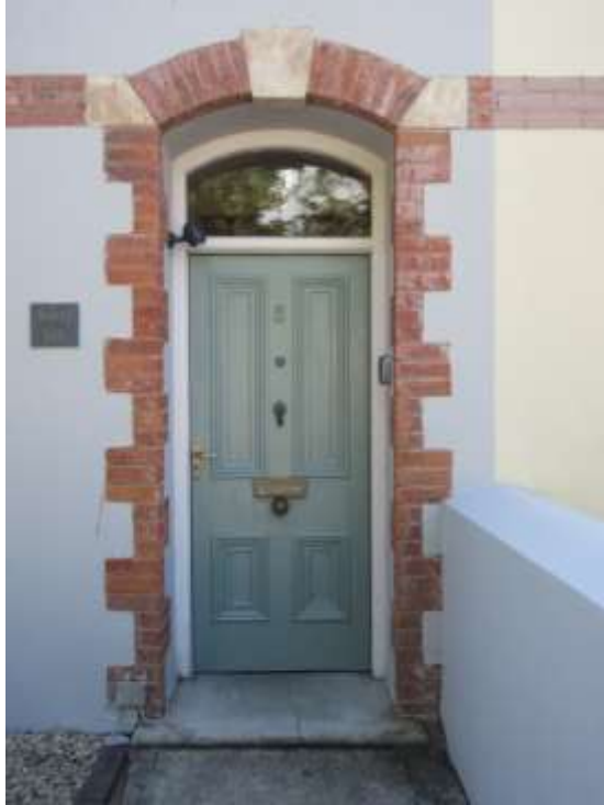
Ffigwr 47 - Dyluniad pedwar panel o ddiwedd y 19eg ganrif