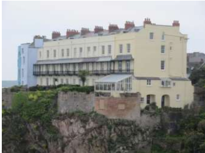
Ffigwr 5 - Teras Lexden (1843-50)