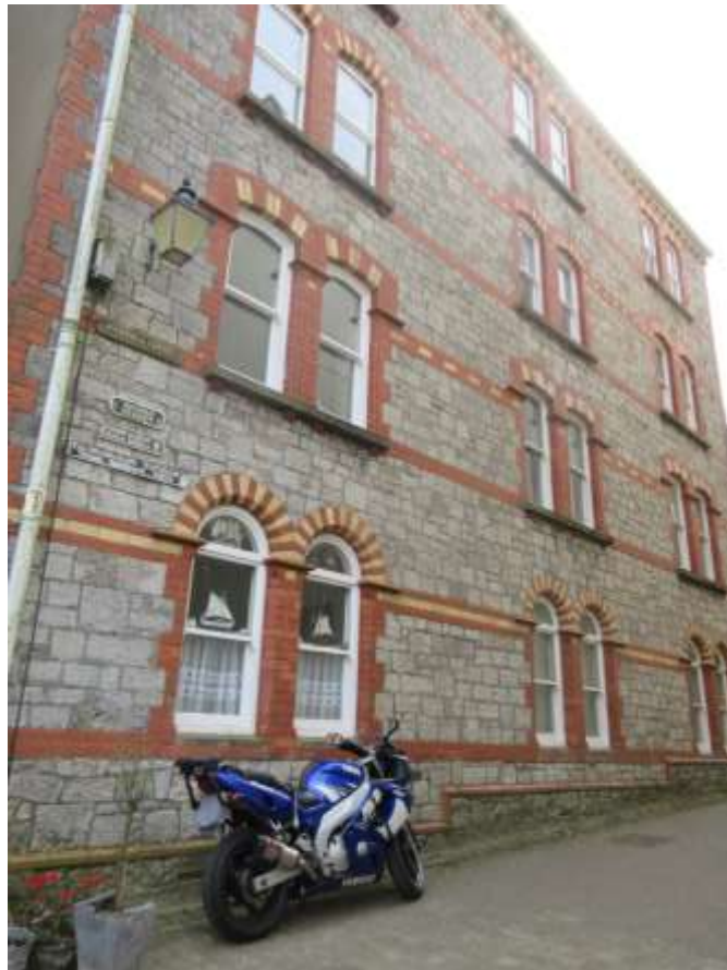
Ffigwr 37 - Ffasâd aml-liwiog, Stryd y Bont, yn dyddio o tua 1890 1890