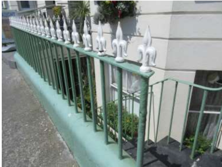
Ffigwr 60 - rheiliau Fictoraidd haearn bwrw a wnaed yn lleol