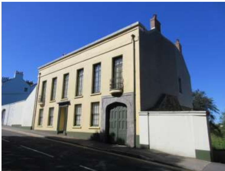
Ffigwr 16 – Ty Norton