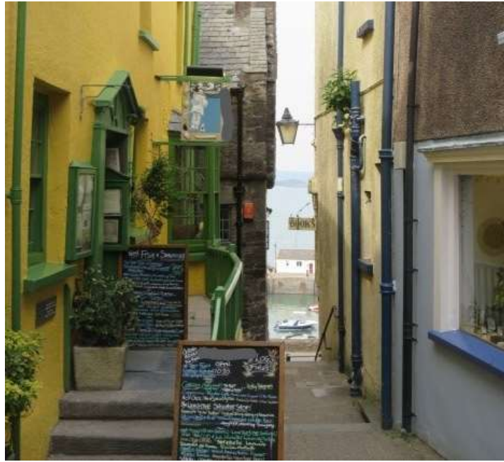
Ffigwr 8 -Cipolwg o'r môr o Riw'r Ceir