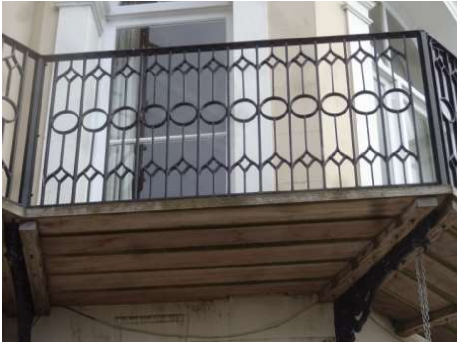
Ffigwr 56 - Balconi Fictoraidd