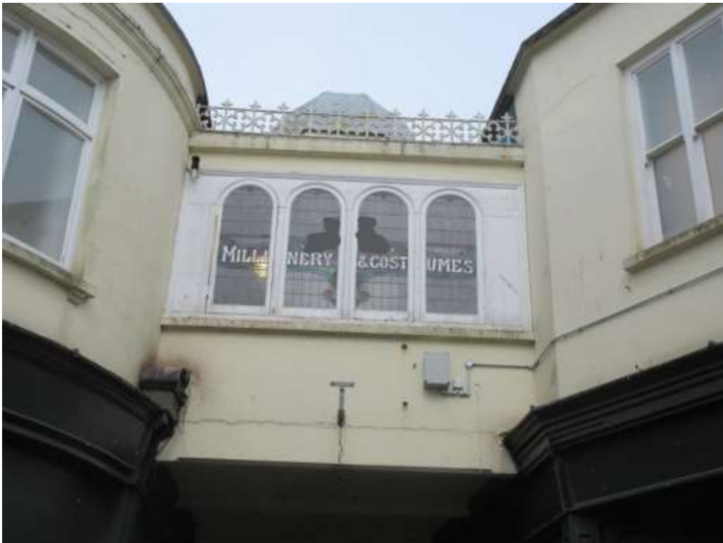
Ffigwr 3 - Dyluniad Edwardaidd