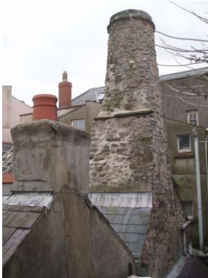
Ffigwr 52 - simnai gron o'r cyfnod canoloesol hwyr