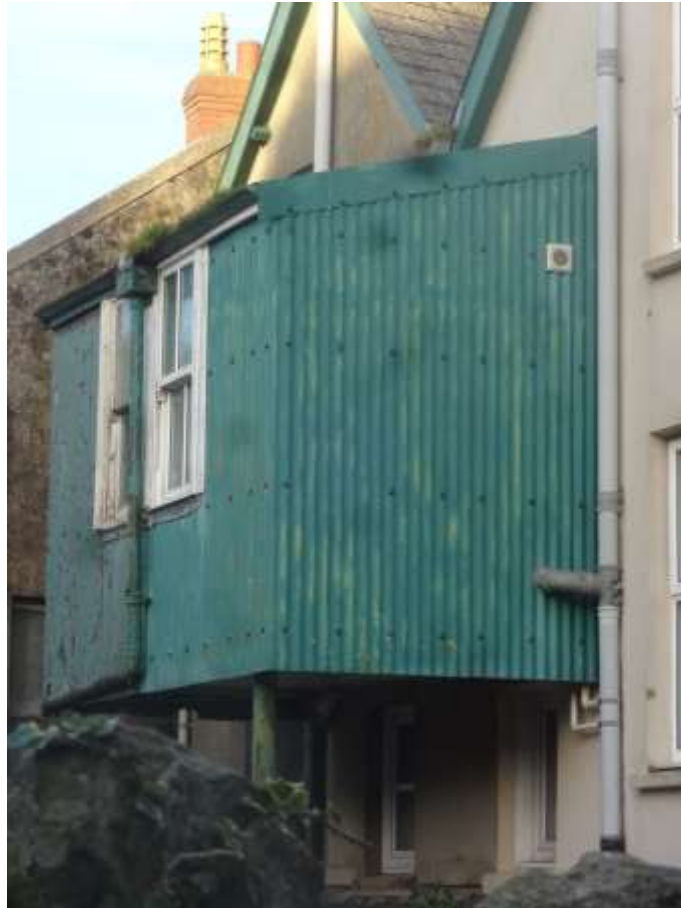
Ffigwr 12 - 'toiledau hedegog', Stryd Sant Julian