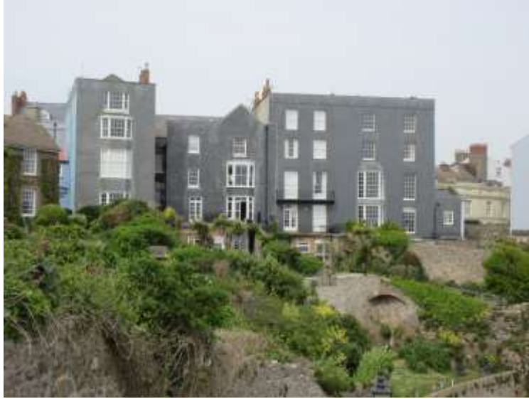
Ffigwr 36 - Cladin llechi, Stryd Sant Julian