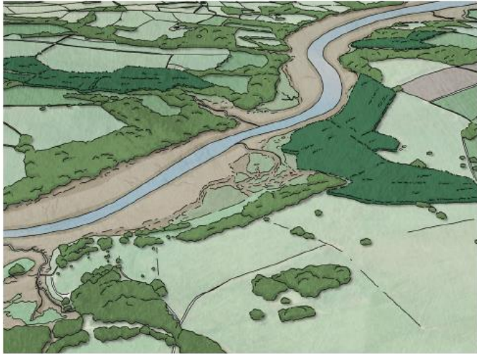
Figure 5.3: Morydau a dyffrynnoedd afonydd: cyfleodd ar gyfer plannu coed a choetiroedd