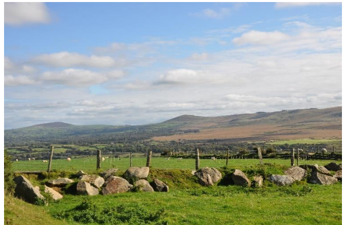
Bryniau Preseli ACT 27

3.5 Mae gan ardaloedd ucheldir Bryniau Preseli (ACT 27) a Bryniau Carningli (ACT 22) goetiroedd helaeth hefyd, wedi'u crynhoi ar y llethrau isaf, gan gynnwys planhigfeydd coniferaidd ym Mryniau Preseli. Fodd bynnag, mae'r coetiroedd hyn yn llai na 10% o gyfanswm gorchudd tir yr ACTau oherwydd eu llethrau uchaf sy'n nodweddiadol agored a digysgod. Mae prysgwydd gwasgarog yn nodwedd ar y llethrau uchaf serth, lle mae'r dirwedd yn trawsnewid i fod yn ardaloedd o ucheldir agored. Mae coetiroedd bach yn dilyn llwybr cyrsiau dŵr llai ac yn cyfrannu at batrwm y dirwedd sy'n cynnwys caeau pori a choetiroedd ar y llethrau isaf.