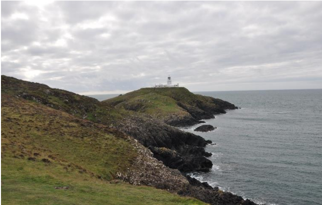
Pen Caer ACT 21

3.7 Ar y pentiroedd agored, gan gynnwys Carn Llidi (ACT 16), Pen Caer (ACT 21), Pen Dinas (ACT 24) a Phen Cemaes (ACT 25), mae coetiroedd yn gyfyngedig i grwpiau bychain o goed yn y dirwedd amaethyddol, neu wedi'u crynhoi yng nghysgod dyffrynnoedd toredig y nentydd sy'n llifo i'r arfordir. Yn aml, nid oes unrhyw goed yn nherfynau'r caeau, ac eithrio mewn ardaloedd mewndirol ymhellach o'r arfordir.