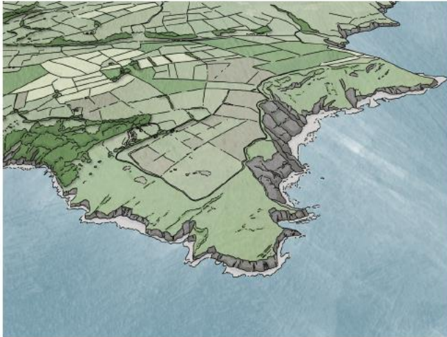
Figure 5.5: Pentiroedd creigiog: cyfleodd ar gyfer plannu coed a choetiroedd