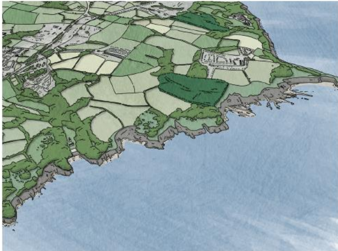
Figure 5.2: Tir amaeth arfordirol coediog: cyfleoedd ar gyfer plannu coed a choetiroedd