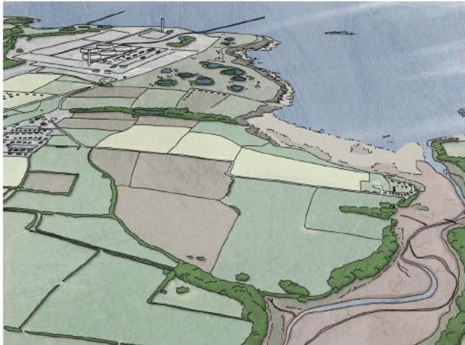
Figure 5.1: Tir amaeth arfordirol agored: cyfleodd ar gyfer plannu coed a choetiroedd