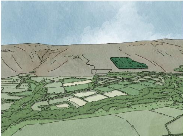
Figure 5.4: Ucheldiroedd: cyfleoedd ar gyfer plannu coed a choetiroedd