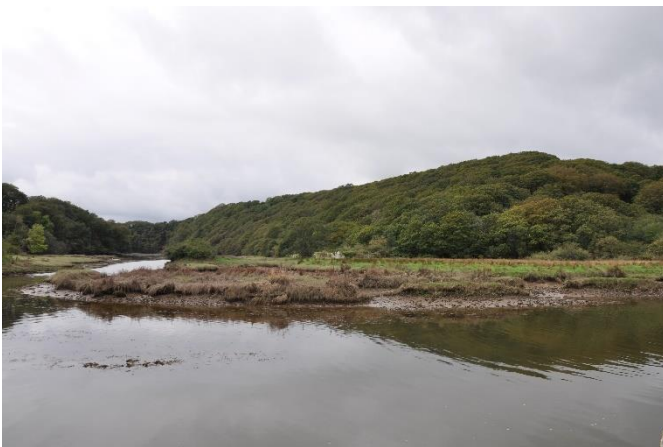
Moryd Daugleddau ACT 28

3.4 Mae gwahaniaethau amlwg o safbwynt gorchudd coetiroedd yn y Parc Cenedlaethol, gydag ardaloedd coediog iawn wedi crynhoi yn nyffrynnoedd yr afonydd a'r morydau. Mae hyn yn cynnwys dyffrynnoedd afonydd Gwaun a Nyfer (ACT 26) ble mae gorchudd coetiroedd yn fwy na hanner arwynebedd y tir ar hyn o bryd (52.6%) ac ar hyd y morydau yn Ystafbwl (ACT 5) lle mae'n 34% a Daugleddau (ACT 28) lle mae'n 20%. Mae gorchudd coetiroedd ar hyd Brandy Brook (ACT 13) a Dyffryn Solfach (ACT 14) yn amrywio rhwng 20% a 7.6% yn y drefn honno. Mae coetiroedd glan afon yn nodwedd gyffredin ar loriau a llethrau'r dyffrynnoedd, gyda