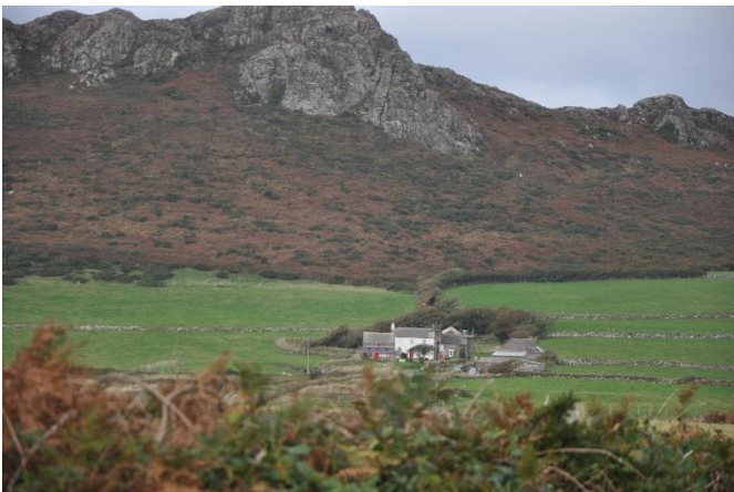
Carn Llidi ACT 16

3.7 Ar y pentiroedd agored, gan gynnwys Carn Llidi (ACT 16), Pen Caer (ACT 21), Pen Dinas (ACT 24) a Phen Cemaes (ACT 25), mae coetiroedd yn gyfyngedig i grwpiau bychain o goed yn y dirwedd amaethyddol, neu wedi'u crynhoi yng nghysgod dyffrynnoedd toredig y nentydd sy'n llifo i'r arfordir. Yn aml, nid oes unrhyw goed yn nherfynau'r caeau, ac eithrio mewn ardaloedd mewndirol ymhellach o'r arfordir.