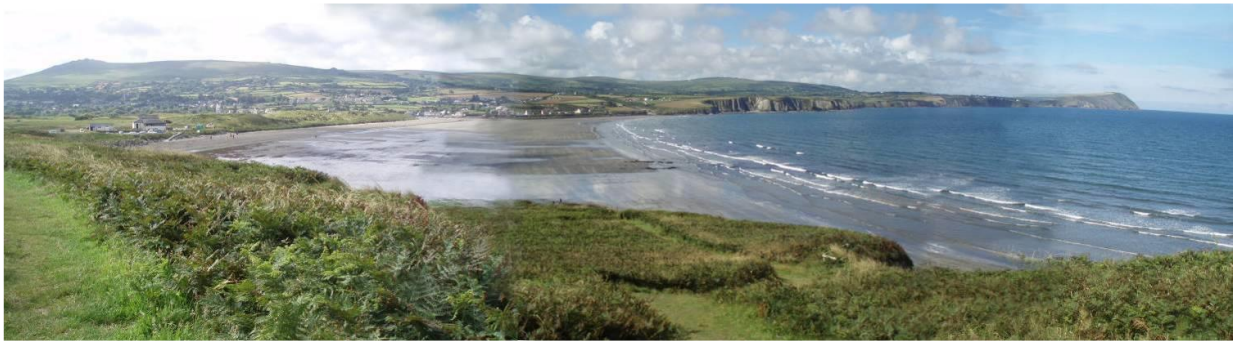
Bae Trefdraeth o Drwyn y Bwa (Photo© PCNPA)