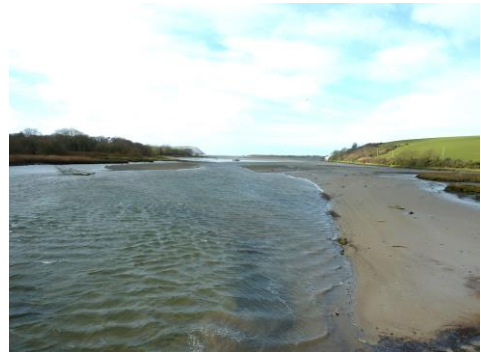
Aber yr afon Nyfer