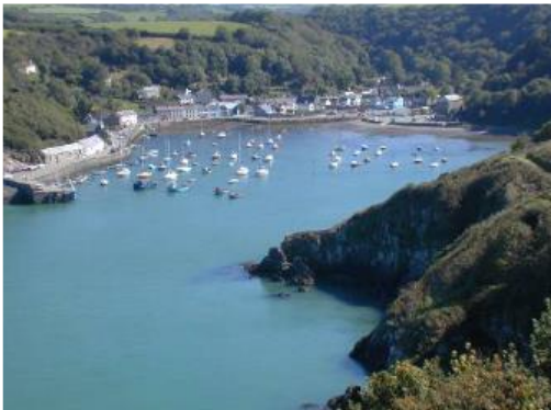
Harbwr gydag Abergwaun uwchben a Wdig yn y pellter