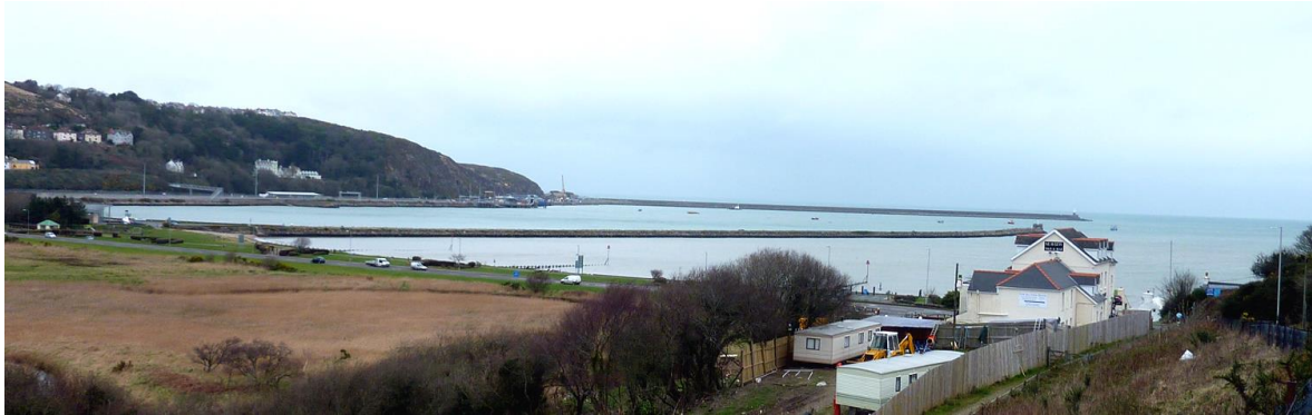
Harbwr a'r terminws llongau fferi yn Wdig