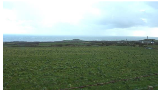
Edrych o bwynt ger Llanwnda at Drwyn Crincoed