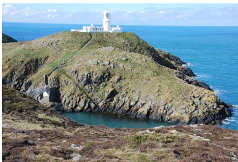
Goleudy Pen-caer yn dangos y clogwyni mewn tywydd llonydd