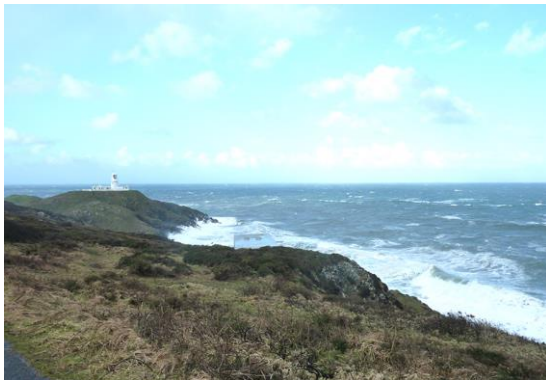
Pen-caer a'r goleudy mewn gwyntoedd uchel