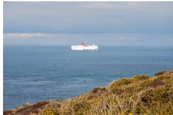
Fferi Iwerddon oddi ar y lan yn teithio at Abergwaun ger Pen-caer