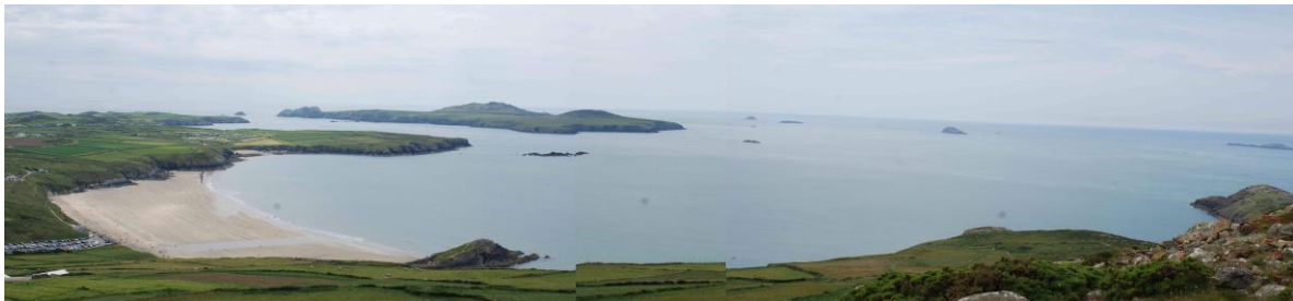
Golygfa o'r Bae ac Ynys Dewi o Garn Llidi