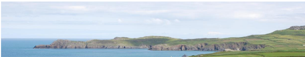
Penmaendewi yn edrych ar draws Y Porth Mawr o Garn Rhosson