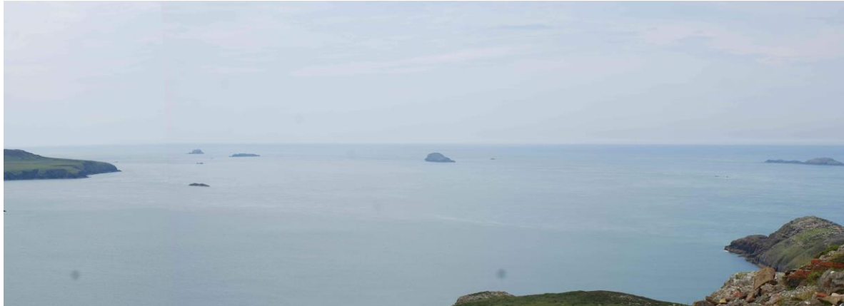
Golygfa o'r Bishops and Clerks o Garn Llidi. Gorwedd Ynys Dewi i'r chwith a Phenmaendewi i'r dde.