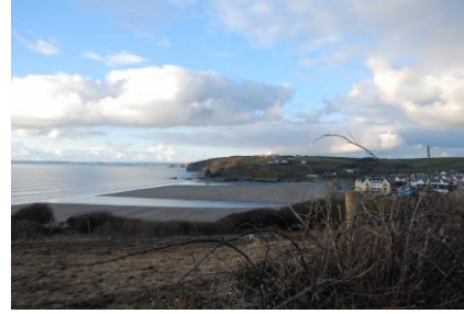
Yr olwafa ar draws traeth Aber Llydan