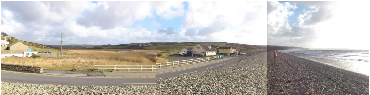
Edruch tua'r de o Niwawl