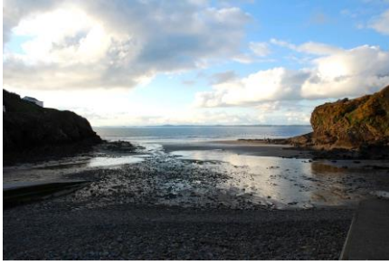
Yr olwafa o Aber Bach ar draws Bae Sain Ffraid