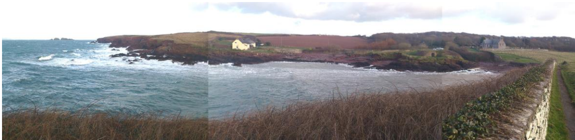
Hafan San Ffraid, Stack Rocks oddi ar y lan yn y pellter