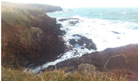
I'r gorllewin tuag at Huntsman's Leap