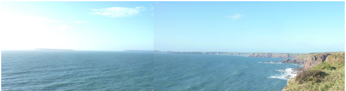
Edrych tua'r dwyrain at Sgogwm (chwith) a phenrhyn Marloes