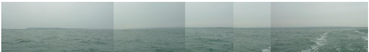
Edrych tua'r gogledd at Sgogwm (chwith) a Phenhyn y Santes Ann (dde) o 2km i'r Dd o Sgogwm, 3.5km o'r lan.