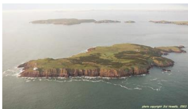
Sgogwm o'r awyr