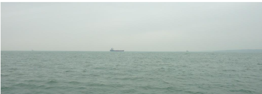
Golwg o'r ardal yn y Môr i'r dwyrain o Sgomer