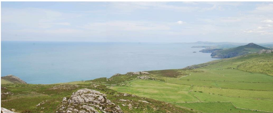
Golwg o gydran ogleddol yr ardal o Garn Llidi gyda SCA13 yn y tir canol