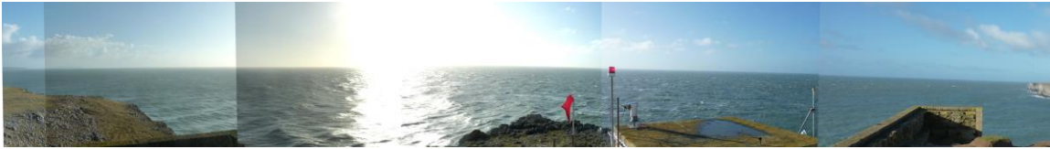
Golygfa dros y môr tuag at y gorwel fel y'i gwelir o Bentir Sant Gofan (yn SCA35) tu hwnt i SCA29