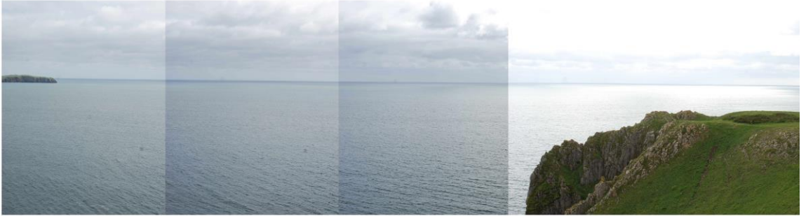
Golygfa dros y môr tuag at y gorwel fel y'i gwelir o Bentir Lydstep, tu hwnt i SCA37