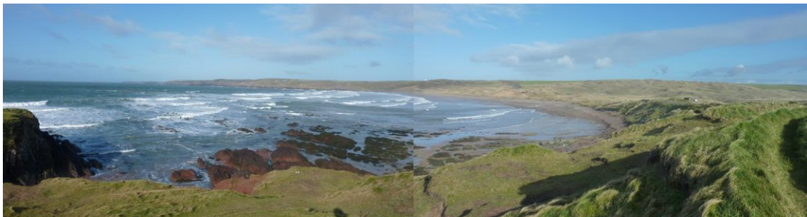
edrych tua'r gogledd ddwyrain o Little Furznpip