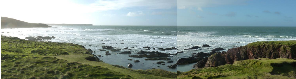
edrych tua'r de o Little Furznpip