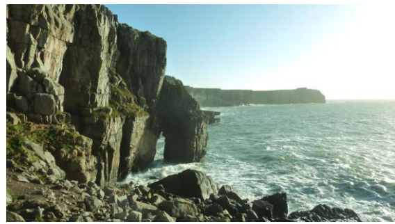
Creigiau a bwâu dan glogwyni calchfaen