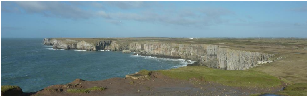
Edrych tua'r gorllewin o Ben Gofan