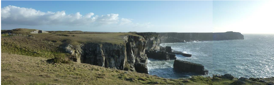
Pen Gofan o'r gorllewin