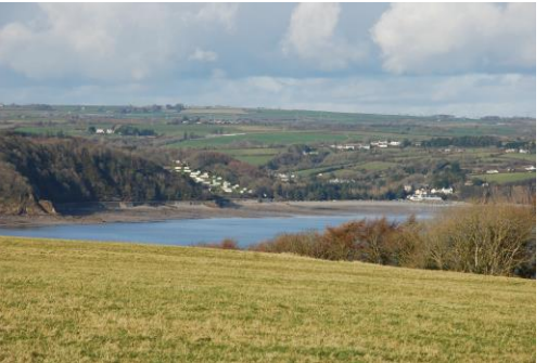
Parciau Carafannau a choetir ar yr arfordir - Wiseman's Bridge