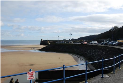
Harbwr a thraeth Saundersfoot