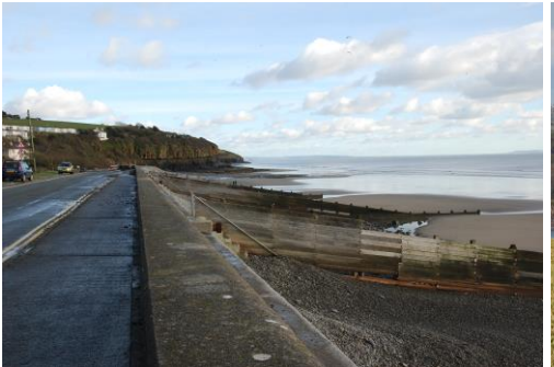
Amroth - morglawdd a grwynau