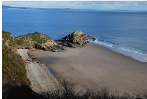
Traeth Monkstone yn darlunio prydferthwch naturiol