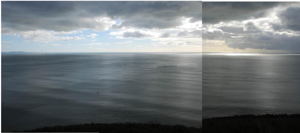
Yr ardal sy'n weladwy o Draeth Pentywyn ym Mae Caerfyrddin - Rhosydd Rhosili yn y Gŵyr i'r dwyrain ac Ynys Bŷr i'r gorllewin [dde]