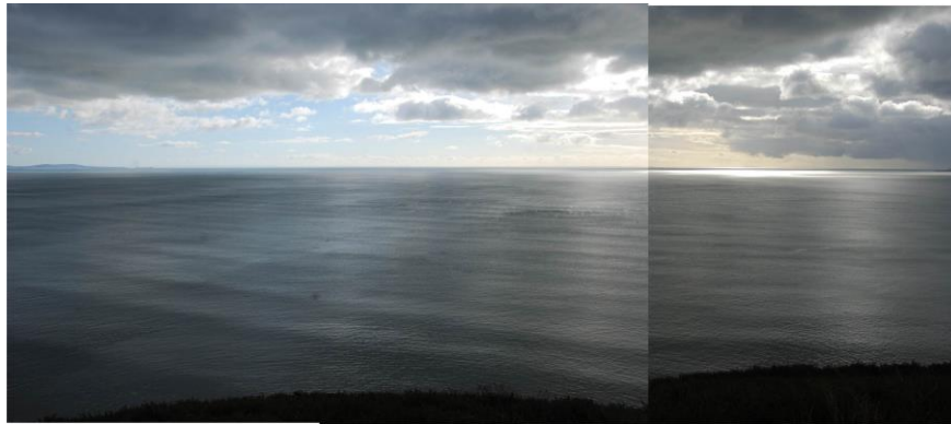
Ardal sros y gorwel o Draeth Pendine ym Mae Caerfyrddin- Rhossili Downs i'r dwyrain ac Ynys Bŷr i'r gorllewin