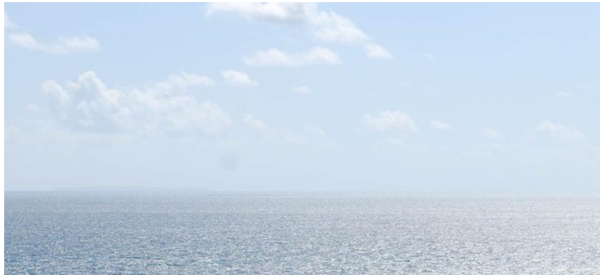
Ardal rhwng yr arfordir ac Ynys Lundy ar y gorwel [i'r chwith] [Golygfa o Benrhyn Gŵyr].