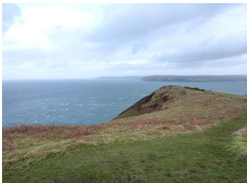
Edrych tua'r gogledd ddwyrain o Ben Dinas (sylwch ar foroedd cynhyrfus y pentir)