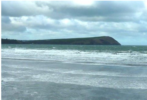
Pen Dinas o Draeth Trefdraeth