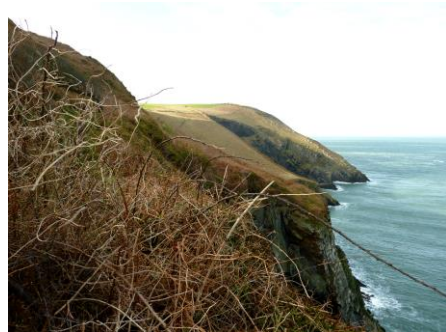
Clogwyni ar Ben Dinas