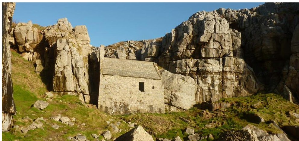
Capel St Gofan

3.46 Perthyn i arfordir ac ynysoedd Sir Benfro naws am le cryf, ymdeimlad cryf a gyfranir ato gan ysblander naturiol yr arfordir a'r ynysoedd bylchog creigiog a marc gweithgaredd dynol fel caerau penrhyn_e.e.Castell Coch, safleoedd crefyddol e.e. capel Sant Gofan a gweithfeydd gadawedig e.e. Porthgain neu Abereididi.