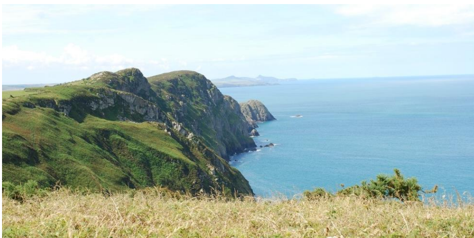
Clogwyni uchel ym Mhenbwchdy