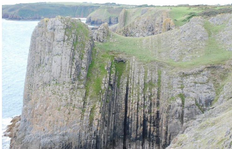
Clogwyni calchfaen carbonifferaidd: Craig Whitesheet