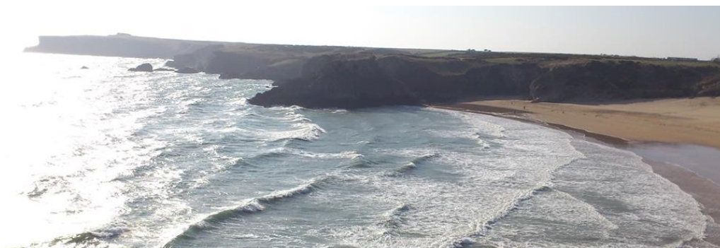
Tonnau yn Aber Llydan (De)