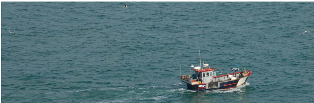
Cwch pysgota (potio) ger Pencaer

3.33 Mae diwydiant pysgota Sir Benfro wedi symud i ffwrdd o'r treillio môr dwfn hanesyddol, gyda llawer o bysgotwyr yn pysgota ger y lan am gramenogion fel crancod a chimychiaid. Golyga hyn bod potiau yn cael eu darganfod ar bron pob glan môr creigiog.