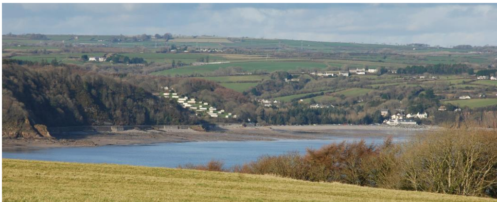
Carafannau yn Wiseman's Bridge

gweithgareddau o'r math. Mae dwysedd y defnydd yn dibynnu ar ba mor hawdd mae'r mynediad ato; mae'r llefydd sy'n caniatáu mynediad cerbyd at, neu'n agos i'r, traeth yn botiau mêl poblogaidd fel Dinbych-y-Pysgod, Saundersfoot ac Amroth i'r de-ddwyrain a Bae Trefdraeth, Niwglwl (Bae Sain Ffraid) a Thraeth Mawr i'r gogledd a'r gorllewin. Mae lleoliadau morlinol eraill yn anghysbell iawn, gyda'r mynediad atynt yn bosib o gwch yn unig. Gall y gweithgareddau amrywio o weithgareddau traeth cyffredinol sydd yn boblogaidd ar y traethau niferus glân, hyd at weithgareddau mwy egniol megis syrffio barcud, dringo, plymio ac arforgampau, camp a ddyfeisiwyd yn yr ardal. Hefyd, pennir dwysedd y defnydd gan wyliau ysgol, yn ogystal â gan y tywydd.