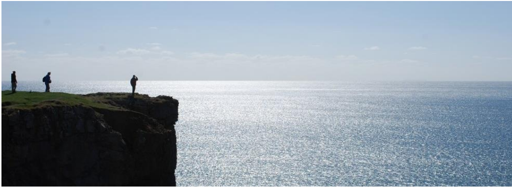
Pentir Stagbwll - golygfeydd panoramig