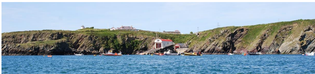
PorthstINAN o Swnt Dewi