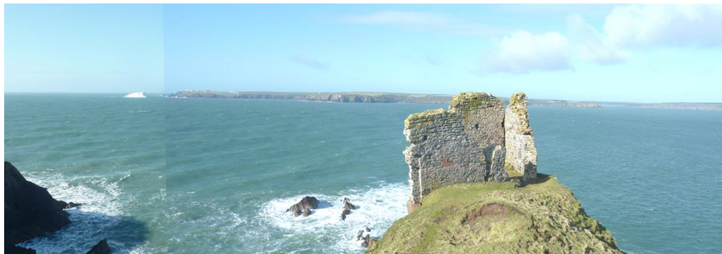
Wrth yr aber yn y Ddau Gleddau

32 ac unwaith eto yn 1844. Roedd yr ardal o'r fath bwysigrwydd strategol fel yr adeiladwyd amddiffynfeydd i warchod y Ddau Gleddau rhag ymosodiad gan lywodraeth ymosodol Napoleon III. Bu dirywiad ar ôl i'r dreadnoughts gael eu cyflwyno ac fe gaeodd y dociau am y tro diwethaf yn 1926. Sefydlwyd iard longau sifil yma hefyd. Yn ystod yr Ail Rhyfel Byd bu Sir Benfro yn rhan bwysig o strategaeth Amddiffyn Arfordir y Gorllewin, pan roedd deuddeg maes awyr yn weithredol. Mae olion i'w gweld o hyd megis, er enghraifft, yr wylfa ar Garn Llidi. Bu Iard Longau Penfro yn ganolfan ar gyfer cychod hedfan milwrol rhwng 1930 a 1959 ac roedd presenoldeb hirsefydlog y Fyddin yn Noc Penfro mewn gwahanol leoliadau gan gynnwys Gorllewin Llanion, Barrack Hill a Thrwyn Pennar.