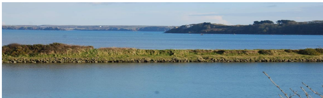
Lagŵn yn Dale