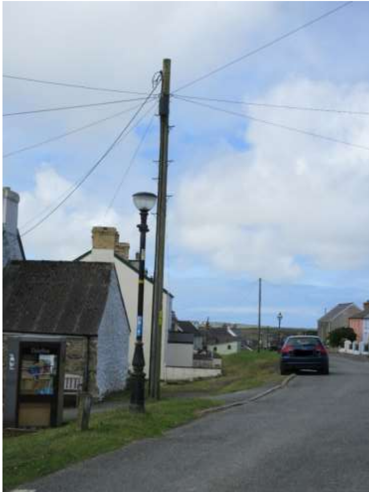
Ffigwr 14 - Agosrwydd goleuadau stryd sensitif a gwifrau ymwithiol