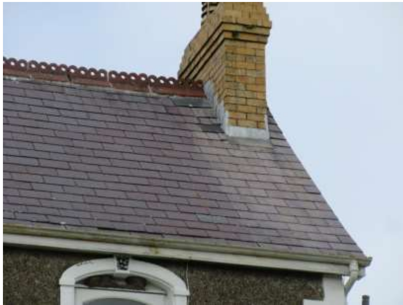
Ffigwr 28 - Llechi Gogledd Cymru