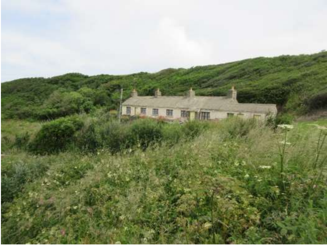
Ffigwr 35 - Y Cwm