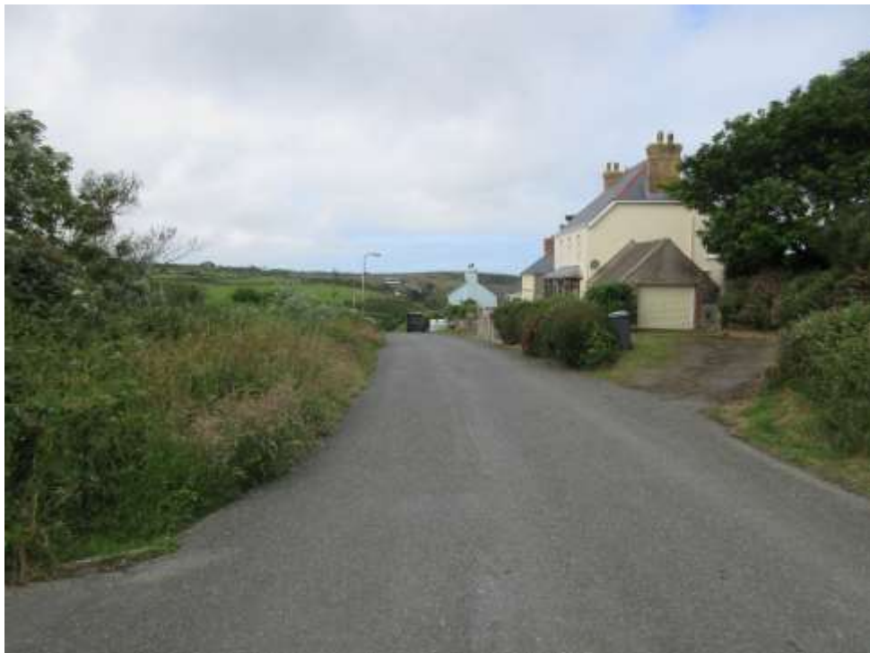
Ffigwr 6 - yr olygfa i'r gorllewin o Ffordd-y-felin