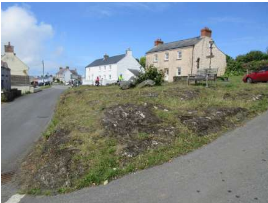
Ffigwr 8 - Carreg-y-Groes