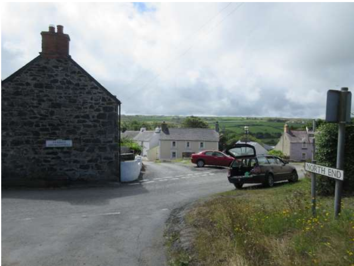
Ffigwr 37 -Yr olygfa o'r Pen Gogleddol