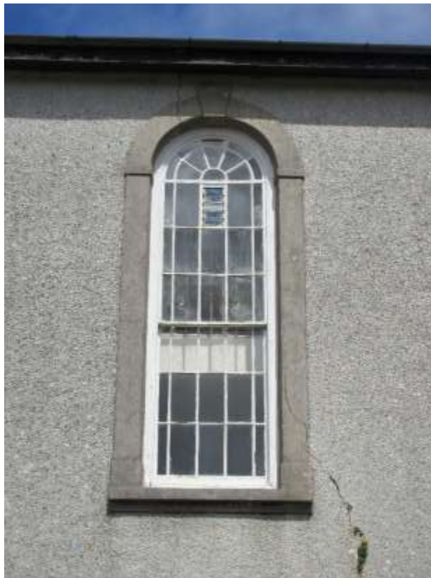
Ffigwr 23 -Ffenestr Capel Methodistiaid Calfinaidd