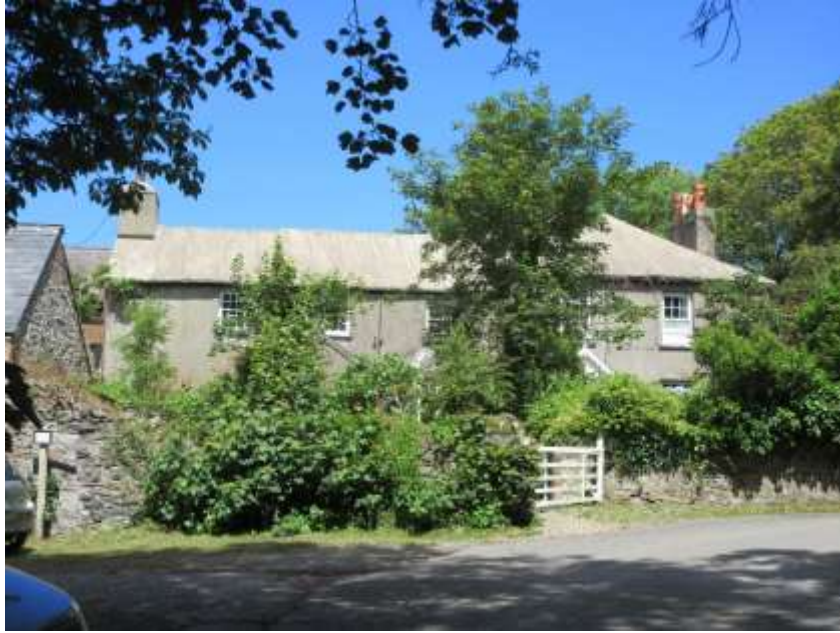
Ffigwr 27 - toeau wedi'u growtio