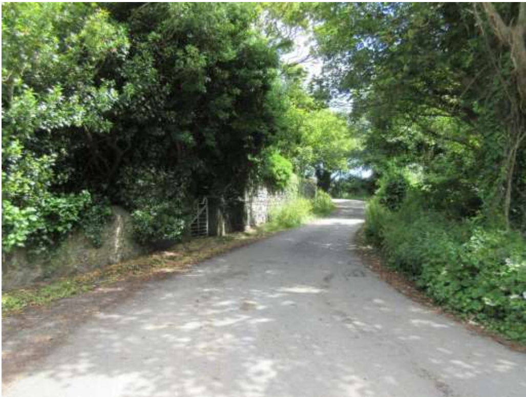
Ffigwr 12 - coed, Cartlett