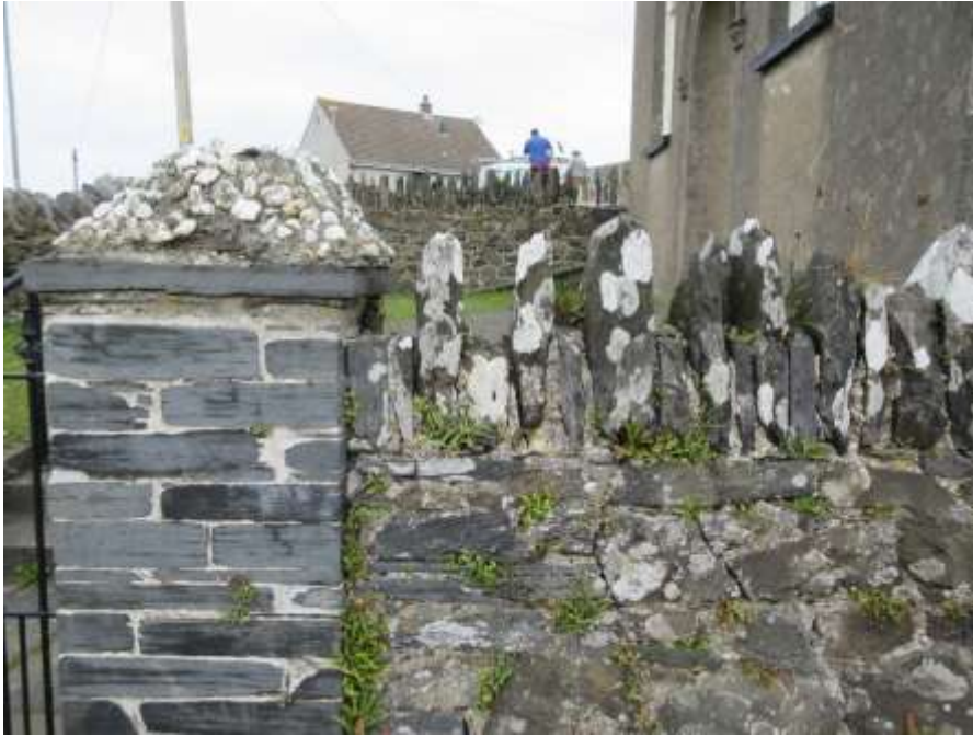
Ffigwr 31 - Waliau hen Gapel y Bedyddwyr