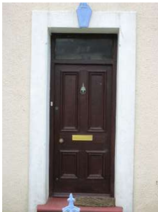
Ffigwr 25 - drws 4 panel gyda ffenestr uwchben