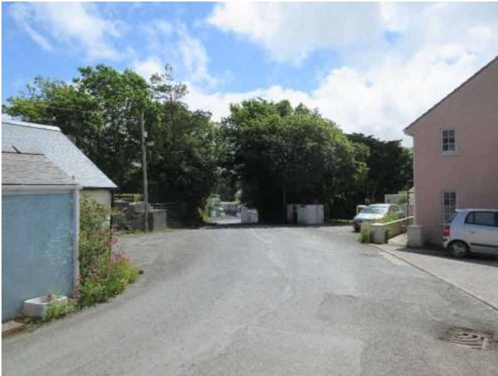
Ffigwr 11 - coed, Ffordd-yr-Afon