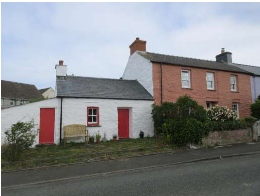
Ffigwr 16 - Rwbol gwyngalchog traddodiadol