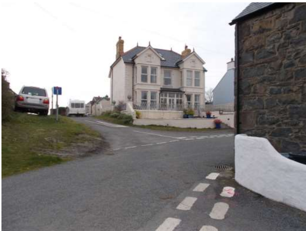
Ffigwr 2 - Adeilad Tirnod