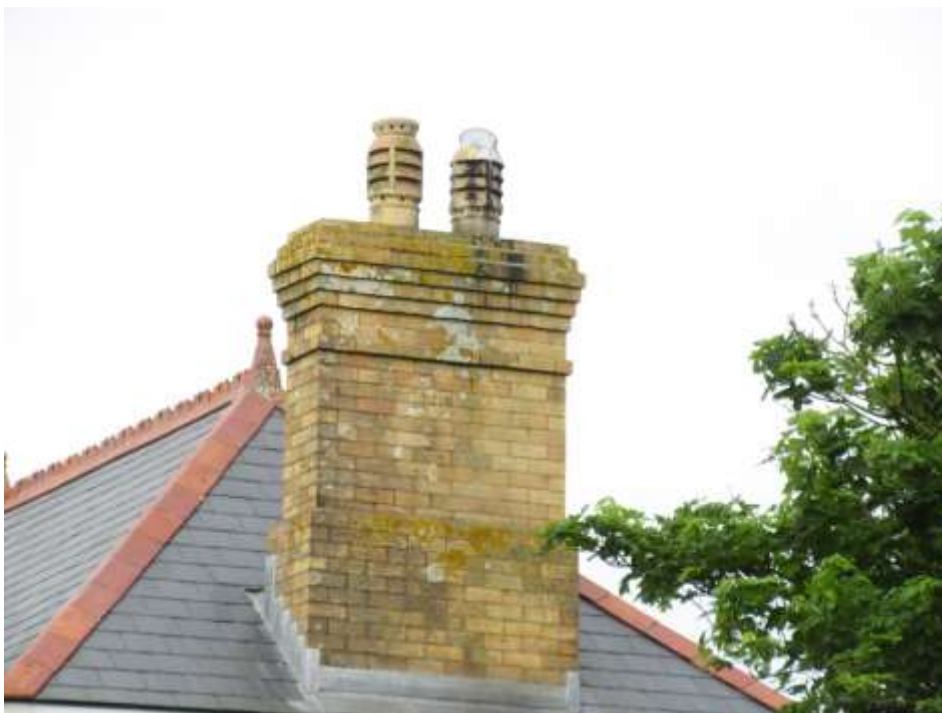
Ffigwr 30 Corn simdde o frics Sir y Fflint