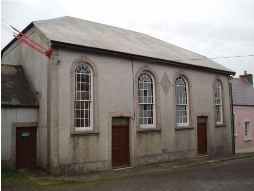
Ffigwr 1 - Capel Methodistiaidd Calfinaidd Tre-fin - Gradd II rhestredig