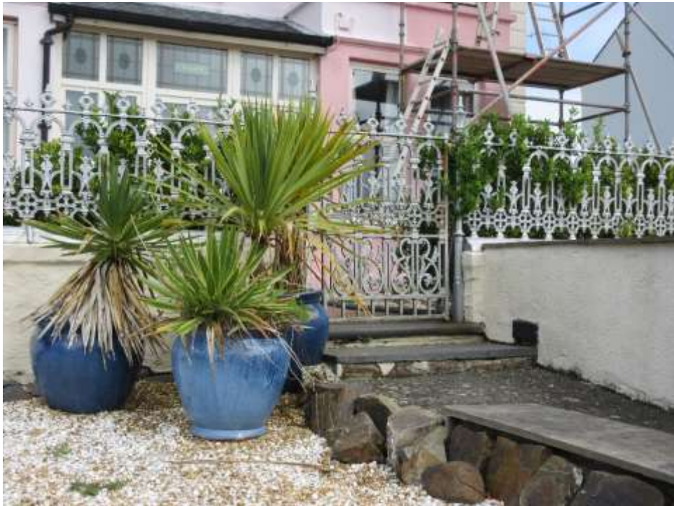
Ffigwr 32 - Rheiliau Edwardaidd