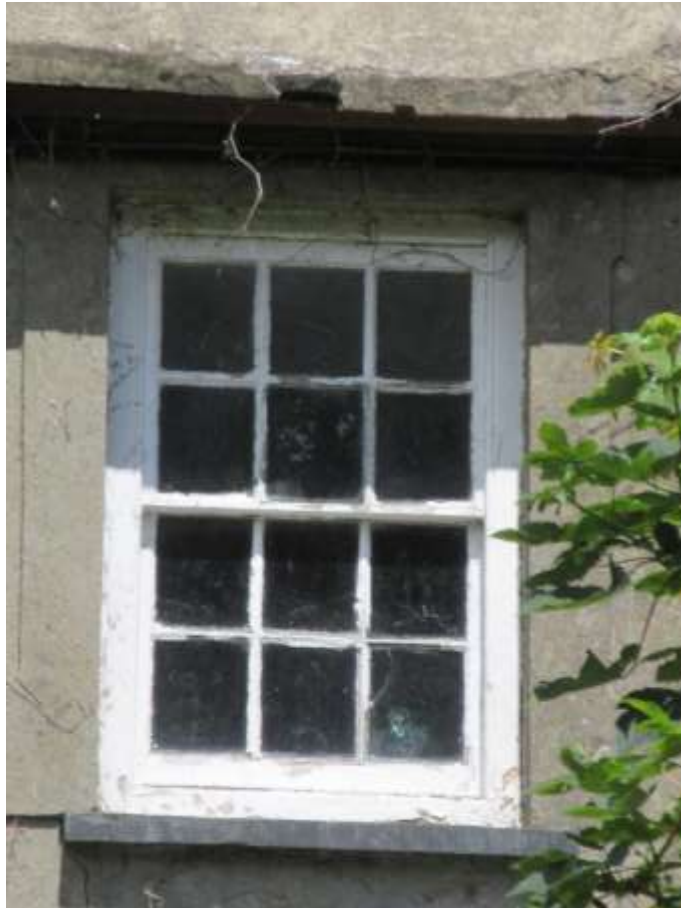
Ffigwr 18 - Ffenestr codi gyda 12 chwarel o'r 19eg ganrif gynnar