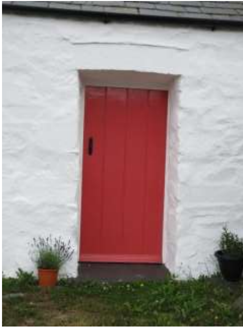
Ffigwr 26 - drws bordiog traddodiadol